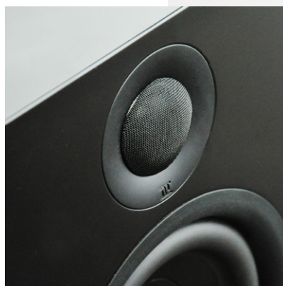
Formschöne Chassisringe um die Treiber werthen die Optik der nuPro XS-Lautsprecher auf.