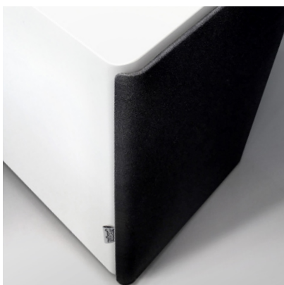
Die mit Akustikstoff bespannten Abdeckungen im nuPro X-Design werden von Magneten sicher gehalten.