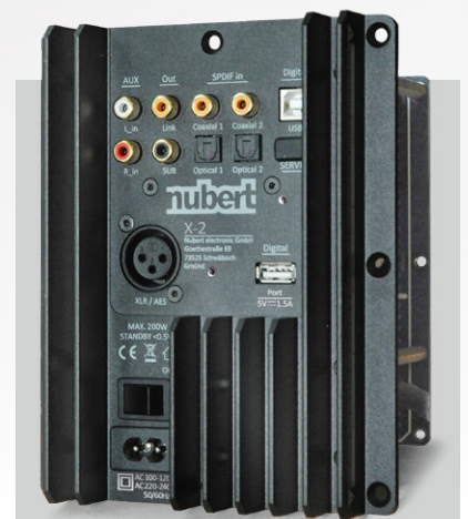
Die Modelle der nuPro XS-Serie bieten vielfältige Anschlussmöglichkeiten – auch für Profi-Anwender.