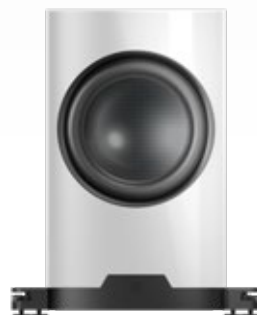
nuVero nova 12