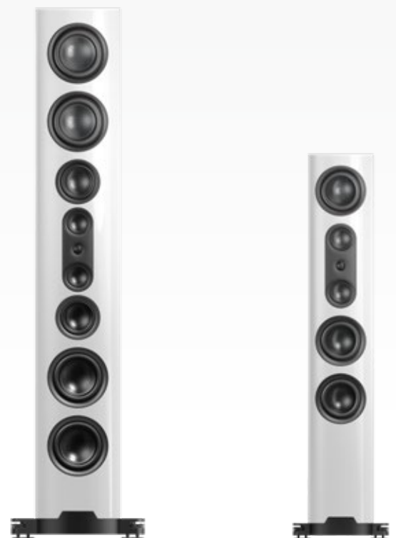
nuVero nova 18