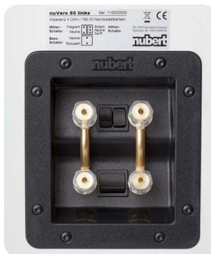
Das Kabelanschlussfeld bietet vier massive Schraubklemmen sowie eine dreifache Klangregelung

Eine weitere Neuerung bei den 2015er-nuVero-Modellen sind die überarbeiteten Chassis. So wurde der Hochtöner komplett neu entwickelt. Er arbeitet über eine 26 Millimeter große Membran aus leichtem Seidengewebe. Zum Schutz der empfindlichen Abstrahlfläche sperrt Nubert die Kalotte hinter ein stabiles Metallgitter, das akustisch keine Auswirkungen auf die Wiedergabequalität hat. Der markante Mitteltöner arbeitet über eine verwindungssteife Flachmembran, die einen Durchmesser von 52 Millimeter besitzt. Dabei ist die effektive Abstrahlfläche asymmetrisch in der Chassis-Frontplatte und somit in der Schallwand angeordnet – gleich dem Hochtöner. Nubert will so das Abstrahlverhalten unter verschiedenen Abhörwinkeln verbessern. Schlussfol-