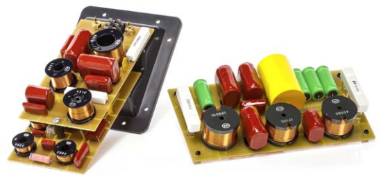
Die Frequenzweiche ist auf mehrere Platinen verteilt und mit toleranzarmen Bauteilen bestückt

Eine der augenscheinlichsten Neuerungen der nuVero-Serie 2015 sind die überarbeiteten Farben. Das ehemals gedeckte Weiß macht nun Platz für ein frisches strahlenderes Weiß, genannt Kristallweiß. Auch das Schwarz wirkt jetzt noch satter und heißt nun Diamantschwarz. Die braune Variante sieht jetzt noch etwas erdiger aus und hört auf den Namen Goldbraun. Nubert hat gut daran getan, den pfiffigen Kontrast zwischen der hochglänzenden Schallwand und dem matten rückwärtigen Korpus beizubehalten. Das sieht nach wie vor richtig schick aus und verleiht den Boxen der nuVero-Serie eine ganz spezielle luxuriöse Optik. Dabei strahlt die gerundete Frontplatte mit einem effektvollen Metallic-Lack, dessen reflektierende Körnung sehr fein und demnach erst auf den zweiten Blick zu erkennen ist. Das dahinterliegende Gehäuse ist sehr matt. Der sogenannte Nextel-Effektlack bietet eine samtig-weiche Oberfläche, die nicht nur unverschämte gut aussieht, sondern sich auch überaus hochwertig anfühlt. Der Lackauftrag selbst ist bei beiden Oberflächen absolut perfekt, gefällt mit sattem makel-