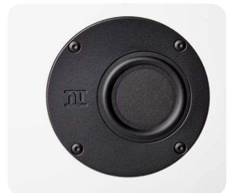
Der neu entwickelte Mitteltöner wirkt über eine resonanzarme Flachmembran und ist außermittig in der Frontplatte positioniert

Beim Hörtest spielen wir zunächst einige moderne Jazz-Stücke mit viel Gesang. Dabei brillieren die nuVero 60 mit einer erstklassigen Stimmwiedergabe. Ob sonorer Männergesang oder obertonreiche Frauenchöre, die kleine Schwäbin meistert sämtliche Mitteltondarbietungen mit Bravour. Der Sound ist tonal perfekt ausbalanciert, überzeugt mit hoher Ausdruckskraft und angenehm seidiger Brillanz. Dabei garniert der Hochtöner das klangliche Geschehen mit seinem hohen Auflösungsvermögen, das jedes noch so kleine Klangdetail zu Gehör bringt. Besonders bei klassischer Musik gefällt die nuVero mit einer mustergültigen Wiedergabe von komplexen Streichinstrumenten-Ensembles. Aber auch bei moderner Pop und Rockmusik klingt die Box außerordentlich