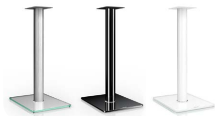
Die passenden Boxenstative BS-752 kosten 239 Euro pro Paar und sind in Silber, Schwarz und Weiß erhältlich

HiFi- und Heimkino-Lautsprecher. Dabei sollte man sich von seiner überschaubaren Größe nicht täuschen lassen. Die nuVero 60 ist ein Standlautsprecher im Kompaktformat. So fordert die außergewöhnliche Leistungsfähigkeit im Tieftonbereich ein gewisses Raumvolumen, damit die nuVero 60 ihre akustischen Vorzüge auch effizient ausspielen kann. Sollte der Bass zu aufgedickt klingen oder die individuelle Raumakustik einen negativen Einfluss auf die Wiedergabe haben, sorgt eine dreifache Klangregelung für die perfekte Tonjustage, ganz nach persönlichem Gusto.