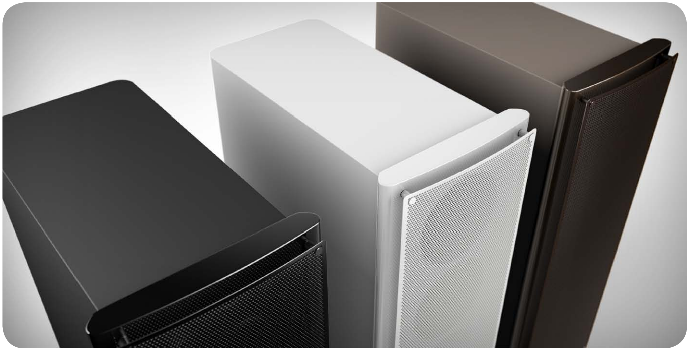
Die Nubert nuVero 60 ist in Schwarz, Weiß und Braun zu haben

nen stehen das typische Single- oder das aufwändigere Bi-Wiring- beziehungsweise Bi-Amping-Verfahren zur Wahl. Bei beiden letztgenannten Verfahren müssen die dicken Kurzschlussbrücken zwischen dem Tief- und Mittelhochtonzweig entfernt werden. Durch die sich daraus ergebende doppelte Kabelführung kann der Klang unter Umständen verbessert werden. Ein Ausprobieren lohnt auf jeden Fall.