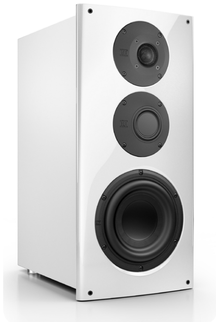
Die nuVero 60 ist ein besonders hochwertiger Kompaktlautsprecher mit dediziertem Tief-, Mittel- und Hochtöner

Die nuVero 60 ist ein waschechter Vollbereichs-Lautsprecher. Dank seiner potenten Technik eignet er sich als hochwertiger