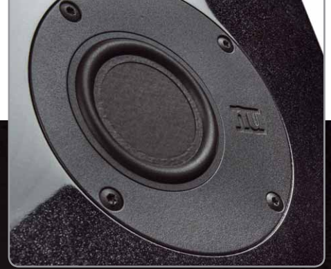
Die neue, hochbelastbare 52-mm Mitteltöner mit asymmetrisch montierter Flachmembran strahlt sehr breitbandig ab