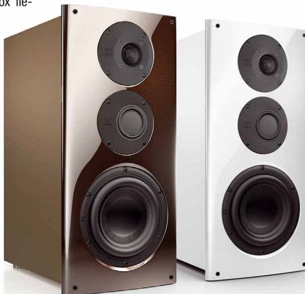
Neuzugang in der nuVero-Familie: Mit der nuVero 60 gesellt sich ein kompakter 3-Wege-Lautsprecher zu Nuberts Top-Linie. Die sanft gerundete, charakteristische Front der nuVero 60 ist in hervorragender Qualität lackiert und in drei modernen Farbtönen erhältlich

Im Akustiklabor zeigt sich die nuVero 60 von ihrer Schokoladenseite: Perfekt ausgewogener Frequenzgang, sensationell geringe Verzerrungen und ein phänomenal gutes Rundstrahlverhalten können wir bedenkenlos bescheinigen. Auch die Tieftonperformance der nuVero 60 ist beachtlich: Ab ca. 35 Hertz spielt sie mit vollem Pegel. Im Hörtest begeisterte die nuVero 60 mit glasklarer Stimmen- und Instrumentalwiedergabe, ohne dass diese zu prägnant und aufgesetzt klangen. Die hervorragenden Rundstrahleigenschaften der nuVero 60 kommen dazu durch sehr präzise räumliche Abbildung des musikalischen Geschehens zum Tragen: Mit packender Breite und Tiefe lässt sich zum Beispiel die hervorragende Aufnahme „As Time Goes By“ von Paul Kuhn und dem Filmorchester Babelsberg genießen. Tonal spielt die nuVero 60 auf höchstem Niveau und selbst bei hohen Lautstärken verblüfft der doch noch