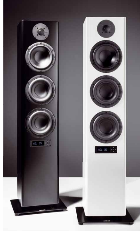
Wahlweise ist die nuPro A-700 in weißer oder schwarz Schleiflack-Ausführung erhältlich

nuPro A-700 Pfißig wie üblich und mit dem richtigen Gespür für die Wünsche der Kunden hat das Team um Günther Nubert die Vorzüge von Aktiv-Monitoren und klassischen Standlautsprechern gepaart und mit der neuen nuPro A-700 einen ausgewachsenen Aktiv-