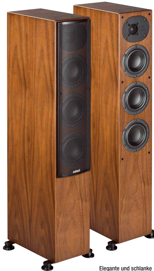
Elegante und schlanke Formgebung der nur 85 cm hohen nuLine 244. Dank perfekt verarbeiteter Echtholz-Oberfläche fügt sich die Nubert in jeden Wohnraum ein

an den Gehäusekanten effektiv auf unterschiedliche Frequenzen verteilt und treten so kaum mehr hörbar in Erscheinung. Für die Tieftonwiedergabe setzen die Nubert-Entwickler aufgrund der schmalen Gehäusefront auf gleich drei langhubige Tieftöner mit 70-mm-Polypropylenmembran, die zusammen mit einer Bassreflexöffnung für beachtlichen Tiefgang der schlanken nuLine 244 sorgen. Unsere Labormessung bescheinigt der 244er eine untere Grenzfrequenz von unter 40 Hertz – Respekt! Für eine individuelle Anpassung der nuLine 244 an den Hörraum oder an Hörgewohnheiten lässt sich mittels zweier Kippschalter auf dem Bi-Wiring-Terminal der Hochton wahlweise anheben oder absenken, der Tiefbass lässt sich bei z.B. wandnaher Aufstellung ebenfalls sanft per Kippschalter reduzieren.