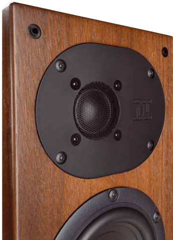
Der Nubert-typische, unsymmetrisch eingebaute Hochtöner sorgt für ein unkritisches Abstrahlverhalten und kaum ausgeprägte Kantenbrechung im Hochton

Labor und Praxis Wie schon erwähnt, beeindruckt die schlanke, elegante nuLine 244 durch enormen Tiefgang bis unter 40 Hertz. Über den gesamten Frequenzgang sind zudem praktisch keine Peaks oder Einbrüche zu erkennen, auch ist das Abstrahlverhalten der eleganten Nubert vorzüglich. Im Hörtest zeigt sich die nuLine 244 recht unkritisch bei der Aufstellung und bietet dank ihres sehr guten Rundstrahlverhaltens fast die freie Wahl des Hörplatzes – es gibt also keinen extrem ausgeprägten Hotspot. Ebenfalls unkritisch ist die 244 bei der Auswahl der Musik, denn die schlanke Standbox fühlt sich sowohl bei dynamischer Rockmusik als