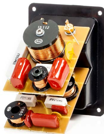
Die Frequenzweiche ist mit hochwertigen Passivbauteilen bestückt und sitzt direkt hinter dem Kabelanschlussfeld

Schon das Vorgängermodell nuBox 481 überzeugte im AV-Magazin-Test vollends. So wundert es kaum, das auch der überarbeitete Nachfolger in jeder Hinsicht begeistert. Beim Hörtest trumpft die nuBox 483