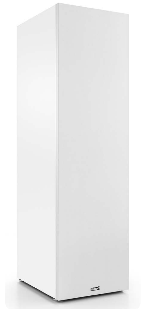
Der Frontrahmen ist im Lieferumfang enthalten und erstklassig verarbeitet

Mit einer Höhe von nur 85 und einer Breite von 24,5 Zentimetern kommt die nuBox 483 gedungen und kraftvoll daher. Die erhabene Optik wird vom stattlichen Konus-töner geprägt, der im oberen Drittel der aufgesetzten Schallwand thront. Für harmonische Optik sorgen die beiden flächen-bündig eingelassenen Töner, die akkurat mit der lackierten Frontplatte abschließen. Die Kunststofffolie zieht sich sauber um den kantige Korpus, gefällt mit griffiger Haptik und tadelloser Verarbeitung. Um die Materialresonanzen der Standbox im Zaum zu halten, gestaltete Nubert das Gehäuse aus massiven MDF-Platten. Beste Standfestigkeit garantieren vier silberfar-