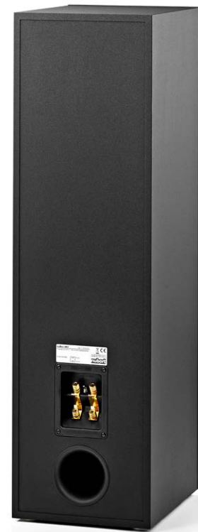
Auf der Rückseite befinden sich ein Kabelterminal und Bassreflexrohr