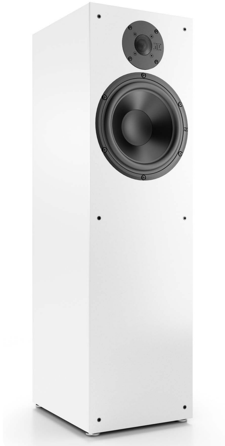
Die Nubert nuBox 483 ist ein passiver Standlautsprecher und kostet 279 Euro zuzüglich Versand

der Lautsprecher wirklich klingt, lesen Sie im folgenden Test. Die Nubert nuBox 483 kostet 279 Euro pro Stück zuzüglich Versand und ist nur direkt bei Nubert erhältlich. Wahlweise im Onlineshop unter www.nubert.de oder in einem der drei Hörstudios in Aalen, Schwäbisch-Gmünd und Duisburg.