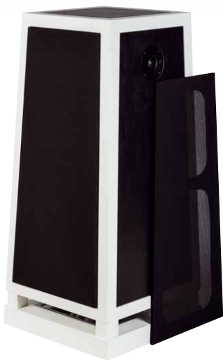
Mit den rundum angesetzten Abdeckungen wird die nicht gerade kleine Box so dezent wie nur möglich