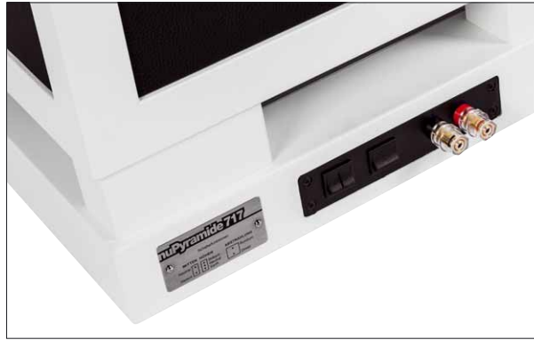
Zusätzlich zu den beiden Betriebsarten kann auch noch der Frequenzgangverlauf an den Raum angepasst werden

den Direktmodus ausgezeichnet hat, etwas verschwommener, die Instrumente werden weniger punktgenau abgebildet. Dafür ist die Tonalität der Wiedergabe über einen wirklich weiten Bereich des Raumes konstant ausgewogen – und das muss man erst einmal hinbekommen. Sogar bei anspruchsvollen klassischen Aufnahmen wie die Eterna-Edition von Carl Orffs „Die