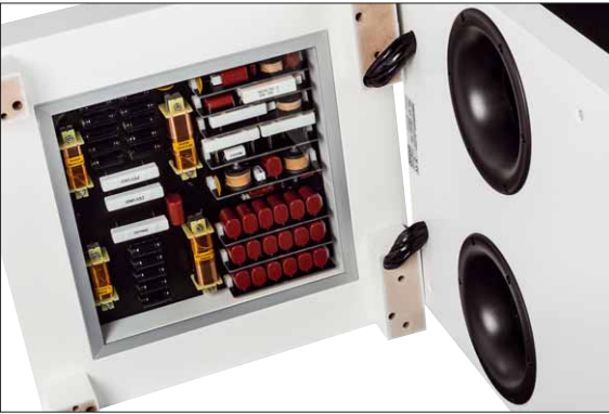
Die Frequenzweiche ist naturgemäß etwas aufwendiger – hier sind ja zwei komplett unterschiedliche Schaltungen integriert