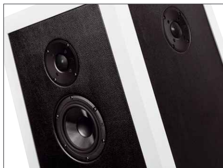
Die seitlichen Hochtöner arbeiten in allen Betriebsarten mit