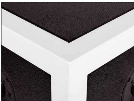
Lackierung und Kunstlederbespannung sind perfekt ausgeführt - besser geht es nicht