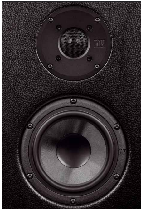
Die Mittel-Hochtonbestückung sorgt für eine dynamische und hoch präzise Wiedergabequalität

Zum einen ist das natürlich der klassische, direkt strahlende Dreiwege-Lautsprecher, bei dem die drei Systeme an der Front zum Einsatz kommen – aber nicht nur: Der zweite Tieftöner auf der Rückseite spielt in allen Betriebsarten mit. Aus gutem Grund: Das Chassis ist ein ausgewiesener Spezialist und auf die Wiedergabe tiefster Töne bis zur unteren Grenze des Hörspektrums getrimmt. Das geht natürlich auf Kosten des Wirkungsgrades, also müssen zwei der Subwoofertreiber hier antreten. Und auch im Hochtonbereich muss die frontseitige Kalotte nicht alleine arbeiten – hier sind auch die seitlichen und der hintere Hochtöner mit im Einsatz – allerdings erst ab etwa 10 Kilohertz, einfach, um den unter Winkeln sinkenden Schalldruck des Haupt-Hochtöners zu kompensieren. Das funktioniert übrigens ganz hervorragend – schon im Direktmodus ist die Nubert damit einer der Lautsprecher, der den Hörer am wenigsten auf einen bestimmten