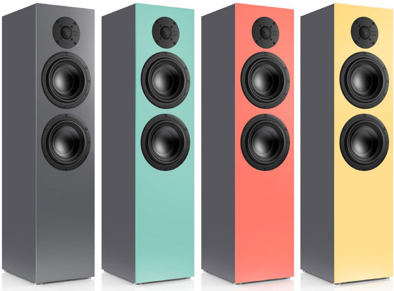
Die Nubert nuBox 425 Jubilee ist mit grauer, türkiser, roter und gelber Schallwand zu haben. Der dahinterliegende Korpus ist bei allen Varianten grau