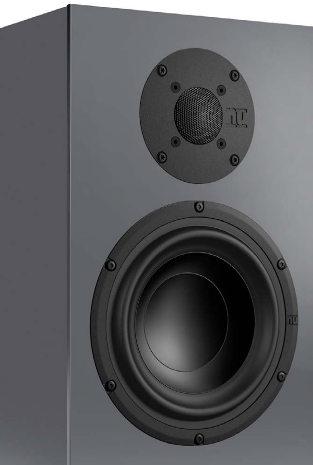
Der Hochtöner sitzt geschützt hinter einem Metallgitter

Gemessen am Preis von nur 375 Euro pro Stück ist es schlichtweg unglaublich, welche fantastische Klangqualität die Nubert-Jubiläumsbox bietet. Der Bass tönt enorm kraftvoll und voluminös, klingt dabei jederzeit präzise und druckvoll. Dank der perfekten Reflexabstimmung ist die Basswiedergabe sehr tiefreichend, was dem kompakten Standlautsprecher ein sattes Fundament beschert. Ist ein ausreichend potenter Verstärker verbunden, präsentiert die nuBox einen spritzig-dynamischen Antritt, der