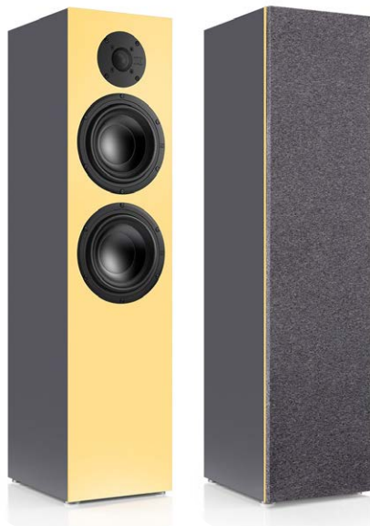
Das nuBox-Gehäuse ist sehr solide und massiv gearbeitet

Die nuBox 425 Jubilee ist ein kleiner Standlautsprecher, der den Wohnraum bereichert, aber nicht dominiert. Mit einer Höhe von 86 und einer Breite von 21 Zentimetern bietet er kraftvolle Proportionen, die seine akustische Leistungsfähigkeit bereits erahnen lassen. Das Gehäuse ist extrem stabil gearbeitet und dementsprechend schwer. Stolze 19 Kilogramm bringt eine nuBox 425 Jubilee auf die Waage, was für einen kompakten Standlautsprecher sehr viel ist. Der Grund dafür liegt im spendablen Materialauf-