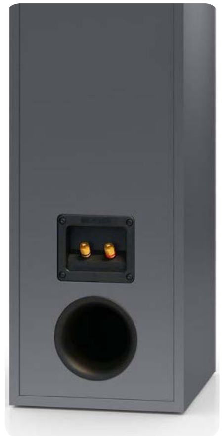
Auf der Rückseite befinden sich das Kabelanschlussfeld und der Bassreflex-tunnel