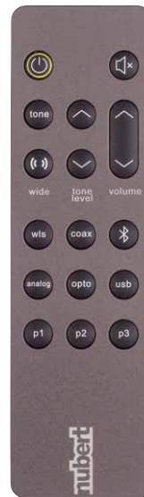
Gespeicherte Presets der Klangregelung können mit der Fernbedienung direkt abgerufen werden

Entzerrung und Masseterminal befindet sich direkt daneben. Damit auch bei der Auswahl des verwendeten Tonarms alle Möglichkeiten abgedeckt sind, kann man den Eingang für MM- oder MC-Systeme umschalten. Digitale Quellen finden sogar ein noch größeres Repertoire an verfügbaren Eingängen vor. Je zwei optische und zwei koaxiale S/PDIF-Anschlüsse warten auf der schmalen Rückseite auf die passenden Kabel. Auch dabei ist Nubert übrigens absolut vorbildlich. Während man selbst bei sehr teuren High-End-Komponenten oft maximal ein Stromkabel im Karton findet, legt man in Schwäbisch Gmünd gleich mehrere unterschiedliche digitale und analoge Verbindungen bei. Unter anderem befindet sich in der Verpackung ein USB-Kabel für den Anschluss am passenden Port des ampX, der sich für die Verwendung mit Laptops, Streamern und Musikservern anbietet.