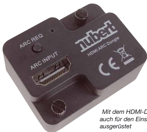
Mit dem HDMI-Dongle ist der Verstärker auch für den Einsatz am Fernseher bestens ausgerüstet

Rückwärtig wartet der nuConnect ampX mit einer üppigen Anzahl verschiedener Anschlüsse auf. Quellgeräte mit Analogausgang wie CD-Player können per Cinch verbunden werden und ein Phonoeingang mit passender