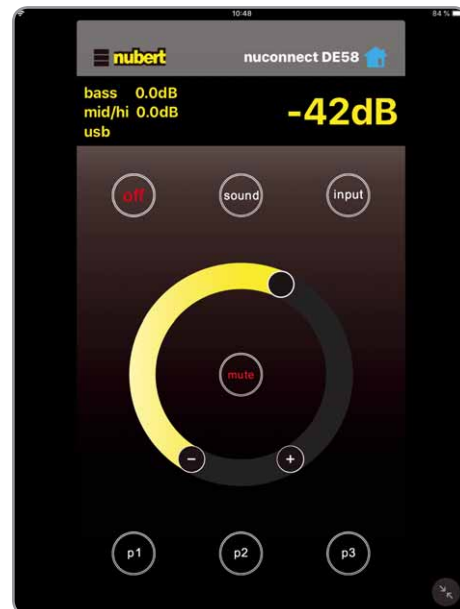
Aufgeräumt und reaktionsschnell ist die App eine hervorragende Steuerungsmöglichkeit, besonders für die umfangreichen DSP-Funktionen