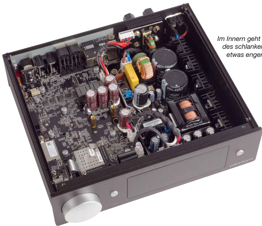
Im Innern geht es aufgrund des schlanken Gehäuses etwas enger zu