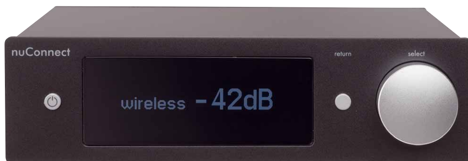
Dank hohem Kontrast ist das große Display auch aus der Entfernung gut ablesbar

Mit diesen Anschlüssen und Fähigkeiten ist der nuConnect ampX absolut hervorragend ausgestattet und es gibt praktisch keine Anwendung, für die man ihn nicht gebrauchen könnte. Eigentlich hätte man sich bei Nubert zurücklehnen und es dabei belassen können. Stattdessen gibt es auch in Sachen Software noch die eine oder andere Überraschung. Neben der Bedienung am Gerät und per Fernbedienung findet man im Play- und im App-Store die Nubert-X-Remote-App. Per Bluetooth baut die App eine Verbindung mit dem Verstärker auf und ermöglicht so die Auswahl der Quellen und die Regelung der Lautstärke. Von hier aus hat man zusätzlich Zugriff auf die umfangreichen Klangeinstellungen, die der Verstärker dem Nutzer bietet. Per DSP lassen sich unterschiedliche Aspekte der Wiedergabe anpassen. Eine Höhen- und Tiefeneinstellung wird hier ebenso geboten wie ein 5-Band-Equalizer. Als sehr effektiv stellte sich auch die Stereoanpassung heraus, bei der die Breite der Bühne in fünf Stufen angepasst werden kann. Bei einem System wie dem ampX aber völlig überraschend ist die Integration einer Einmessautomatik. Hier wird das Smartphone oder Tablet