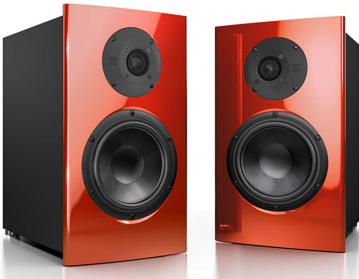
Ungewöhnlich und reizvoll: die rubinrote Variante des Jubiläumslautsprechers ist eine Augenweide