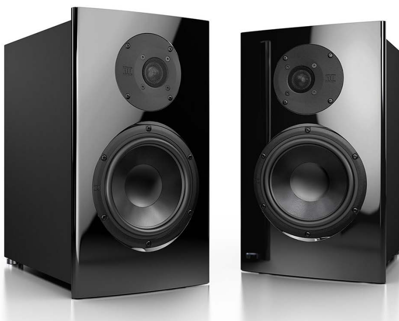
Die gebogene Schallwand glänzt mit effektivem Metallic-Lack

ten Box. Mit einer Höhe von 40,5 und einer Breite von 23,4 Zentimetern ist die nuJubilee 45 zudem ein gestandenes Tonmöbel, das den Wohnraum geschmackvoll bereichert. Dank der erstklassigen Material- und Verarbeitungsqualität ist dieser Lautsprecher somit ein optischer und haptischer Leckerbissen für Audio-Gourmets.