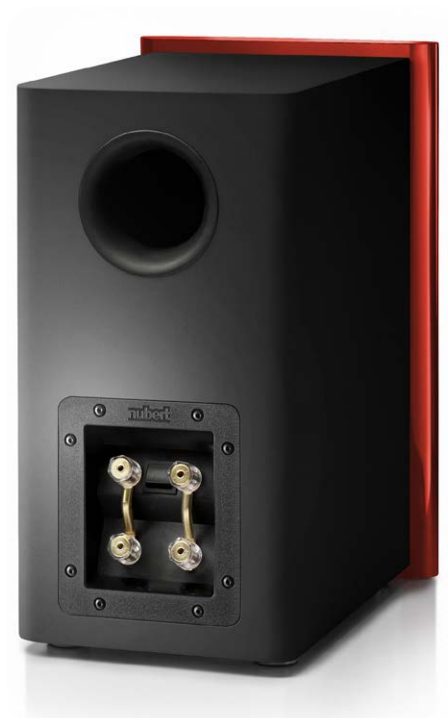
Der rückwärtige Korpus ist mit ultramattem schwarzem Nextel-Lack versehen und sieht einfach klasse aus

ben sind, stattet Nubert die nuJubilee 45 mit dem aktuellen, überarbeiteten nuVero-Hochtöner aus. Dieser wirkt über eine 26 Millimeter messende Kalottenmembran, die aus Seidengewebe gefertigt ist. Für die Übertragung mittel- und tieffrequenter Tonumfänge ist ein stattlicher Konustöner im Einsatz, der über eine besonders verwindungssteife Membran verfügt. Dank Glasfaserverstärkung bietet dieses Chassis eine sehr gute Dämpfung bei geringem Eigengewicht. Um das tieffrequente Leistungsvermögen der nuJubilee 45 zu optimieren, wirkt der Tiefmitteltöner in ein rückwärtiges Reflexgehäuse. Die dafür notwendige Belüftung wird durch ein Tunnelrohr sichergestellt. Dieses befindet sich auf der stark gerundeten Rückseite der Box. Darunter ist ein opulentes Kabelanschlussfeld flächenbündig in den dickwandigen Korpus eingelassen. Die elektrische Verbindung zum Verstärker erfolgt über zwei oder vier massive Schraubklemmen, die ab Werk mit Kurzschlussbrücken verbunden sind. Werden diese entfernt, kann die nuJubilee 45 im Bi-Wiring- oder auch Bi-Amping-Verfahren mit einer oder zwei Endstufen betrieben werden. Für die optimale Klanganpassung