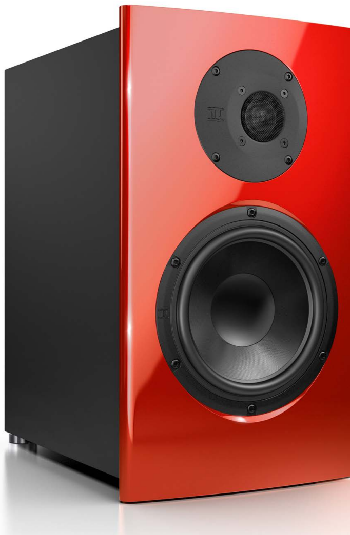
Tiefmittel- und Hochtöner sind flächenbündig in die aufgesetzte, dickwandige Frontplatte eingelassen

Die nuJubilee 45 ist ausschließlich mit einem schwarzen Korpus zu haben. Die nach vorne aufgesetzte Schallwand im Design eines Klangsegels ist wahlweise in Rubinrot oder Schwarz erhältlich. Während die leichte gebogene Frontplatte mit einem effektiv glänzenden Metallic-Lack versehen ist, kommt der dahinterliegende schwarze Korpus mit einem gediegenen, weil samtigmatten Nextel-Lack daher. Der optisch Kontrast zwischen der reflektierenden und absorbierenden Oberfläche wirkt besonders edel. Je nach Winkel des einfallenden Lichts verändert sich die Erscheinung der kompak-