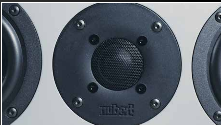
Die Töner können prinzipiell im Format gedreht werden. Wollen Sie die Lautsprecher hochkant nutzen, dann kann sich so auch das Logo passend mitdrehen. Sieht besser aus