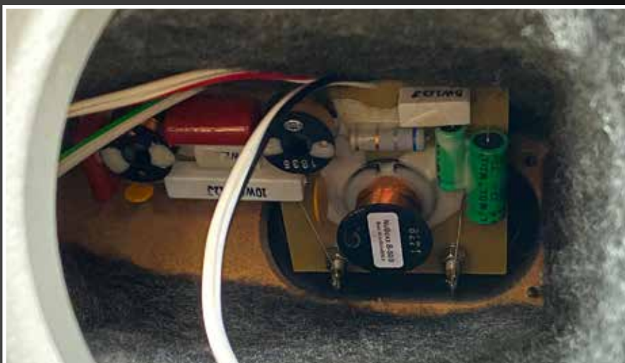
Einfach mal den Treiber ausbauen und einen Blick auf die neue Frequenzweiche werfen. Extra für Nubert entwickelte Bauteile, hochwertig und gewissenhaft ausgeführt

Lautsprecher wurden natürlich auch überarbeitet. Das Bi-Wiring-Terminal ist einem regulären Single-Wire-Anschluss gewichen. Die Nachfrage nach Bi-Wiring und Bi-Amping ist in Deutschland im Vergleich zu anderen Ländern deutlich geringer. Auch die Schalter zur eventuellen Anpassung der Frequenzweiche sind verschwunden. Aber wer jetzt denkt, das sind bestimmt alles Sparmaßnahmen und Nubert möchte einfach etwas an der Marge drehen, der hat weit gefehlt. Die Bauteile, bzw. die Energie und Aufmerksamkeit wurde stattdessen dafür genutzt, die Lautsprecher und Frequenzweichen besser auf ihre Einsatzgebiete abzustimmen. So ist die Frequenzweiche des Wandlautspre-