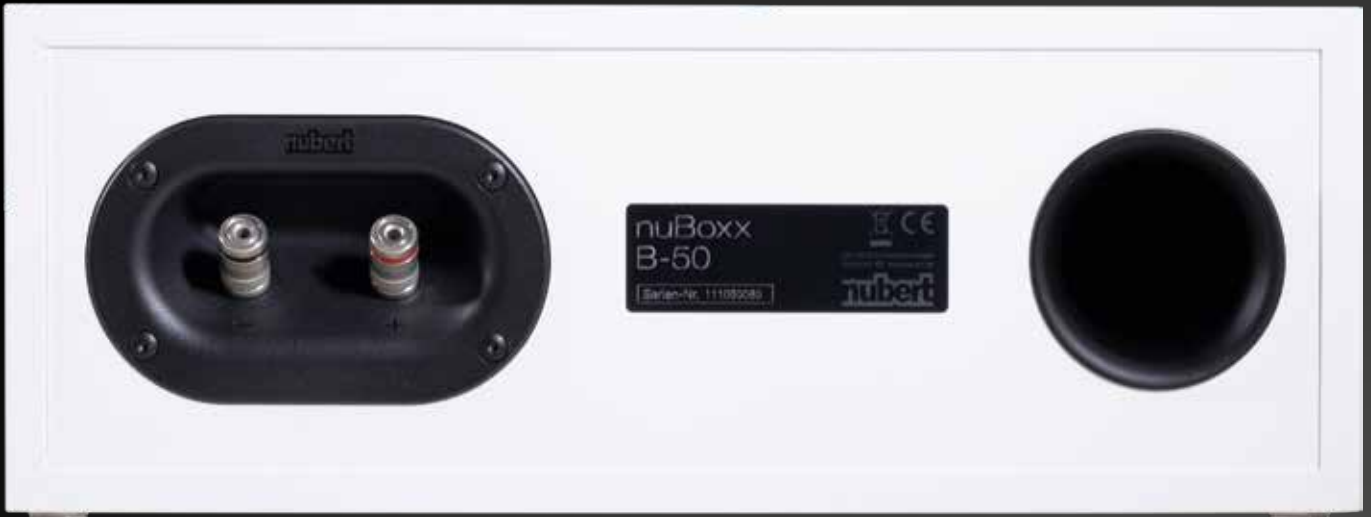
Die neuen Anschlüsse wirken deutlich stabiler als noch in der Vorgänger-Version. Natürlich wurden auch Typenschild und Bassreflex in der neuen Iteration überarbeitet

kant auf den Schreibtisch, dann sind ja die Logos verkehrt. Nubert hat hier mitgedacht. Aufgrund der symmetrischen Vierpunktverschraubung der Treiber und des D'Appolito-Aufbaus ist ein drehen der Treiber um 90 Grad in die Gewünschte Position überhaupt kein Problem. Wir haben das selber ausprobiert, weil wir wissen, dass viele Kunden auf solche vermeintlich kleinen Details großen Wert legen. Es ist überhaupt kein Problem die Treiber mit einem Schraubendreher vom Gehäuse zu lösen, denn die Treiber sind nicht verklebt. Sogar die Aussparungen für die Kabel des Hochtöners hat Nubert bereits prognostiziert und die Kabel im Inneren sind auch lang genug. Treiber drehen, wieder festschrauben, fertig ist die wunderschöne Hochkant-Variante. Inklusive lesbarer Nubert-Logos. Selbst bei den Logos der Blenden ist ein vorsichtiges Ablösen und neu Positionieren durchaus realistisch, sollte aber natürlich nicht jeden Tag aufs neue gemacht werden, weil natürlich der Kleber auf der Rückseite des Logos irgendwann seinen Geist aufgeben würde. Aber: Alles möglich. Hochkant B-50, yes you can. Wir müssen aber natürlich an dieser Stelle ausdrücklich darauf hinweisen, dass es bei der Re-Montage der Lautsprecher absolut legitim wäre von Nubert zu sagen, dass die Garantie darunter leidet. Dieses optische Tuning also bitte nur, wenn Sie sich sicher sind und nicht vorhaben