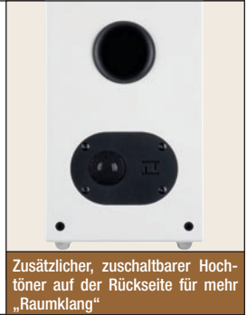
Zusätzlicher, zuschaltbarer Hochtöner auf der Rückseite für mehr „Raumklang“

Mit einer Höhe von 24 cm und einer Breite von 15 cm gehört die nuLine 24 vom schwäbischen Lautsprecher-Spezialist Nubert zu den besonders kompakten Vertretern seiner Gattung. Dabei hat es die „Kleine“ faustdick hinter den Ohren.