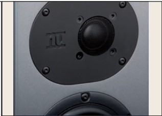
Unsymmetrischer Hochtöner für geringer ausgeprägte Schallbrechung an Kanten