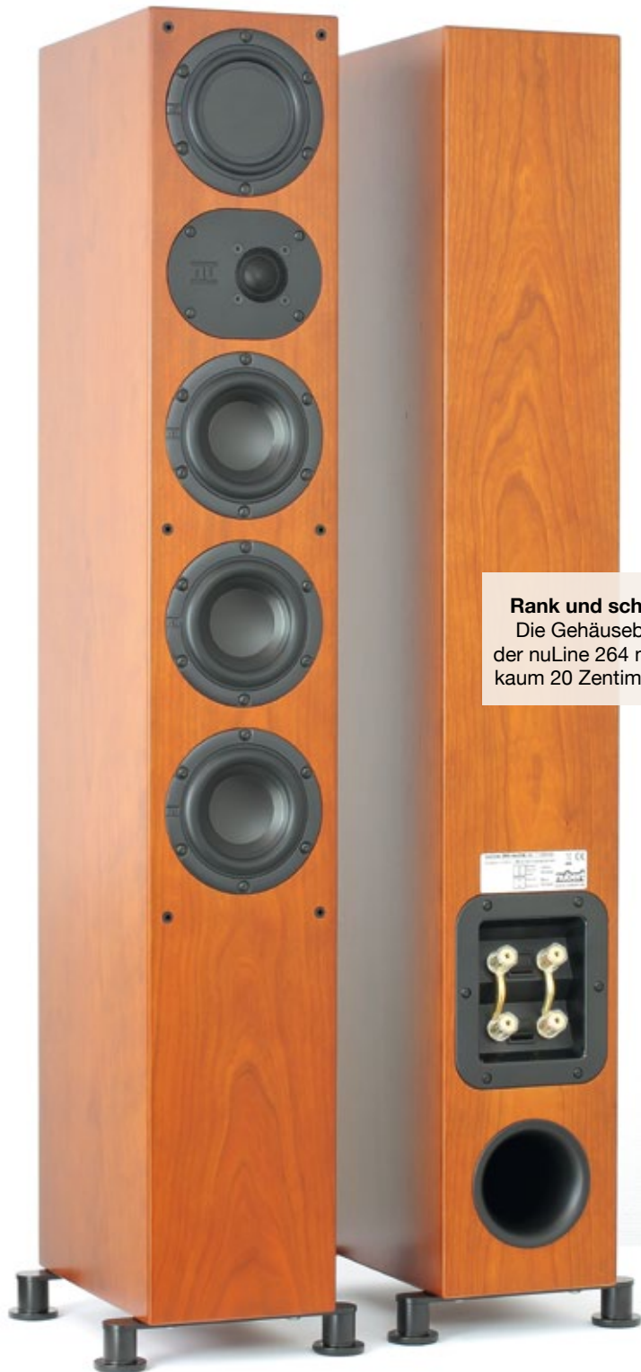
Rank und schlank Die Gehäusebreite der nuLine 264 misst kaum 20 Zentimeter

Stunde ausführlich widmete. Glücklicherweise spiele ich dort auf einem E-Drum-Set, sodass sich solche raumakustischen Problemfälle auch ohne größere bauliche Maßnahmen durch entsprechende elektronische Entzerrung korrigieren lassen – falls der Lautsprecher das mitmacht. Als überzeugter Bose-L1-S2-User weiß ich mich in dieser Hinsicht jedoch absolut auf der sicheren Seite. Durchschlagenden Erfolg brachte schließlich ein sehr schmalbandiges Absenken bei 70 Hertz um beinahe zehn Dezibel: Auf Anhieb war das Dröhnen verschwunden – was den akustischen Weg freimachte für bisher kaum gehörte Tiefbassanteile beider Trommeln, die bei rockigeren Lautstärkepegeln beinahe die Fensterscheiben zerbersten ließen.