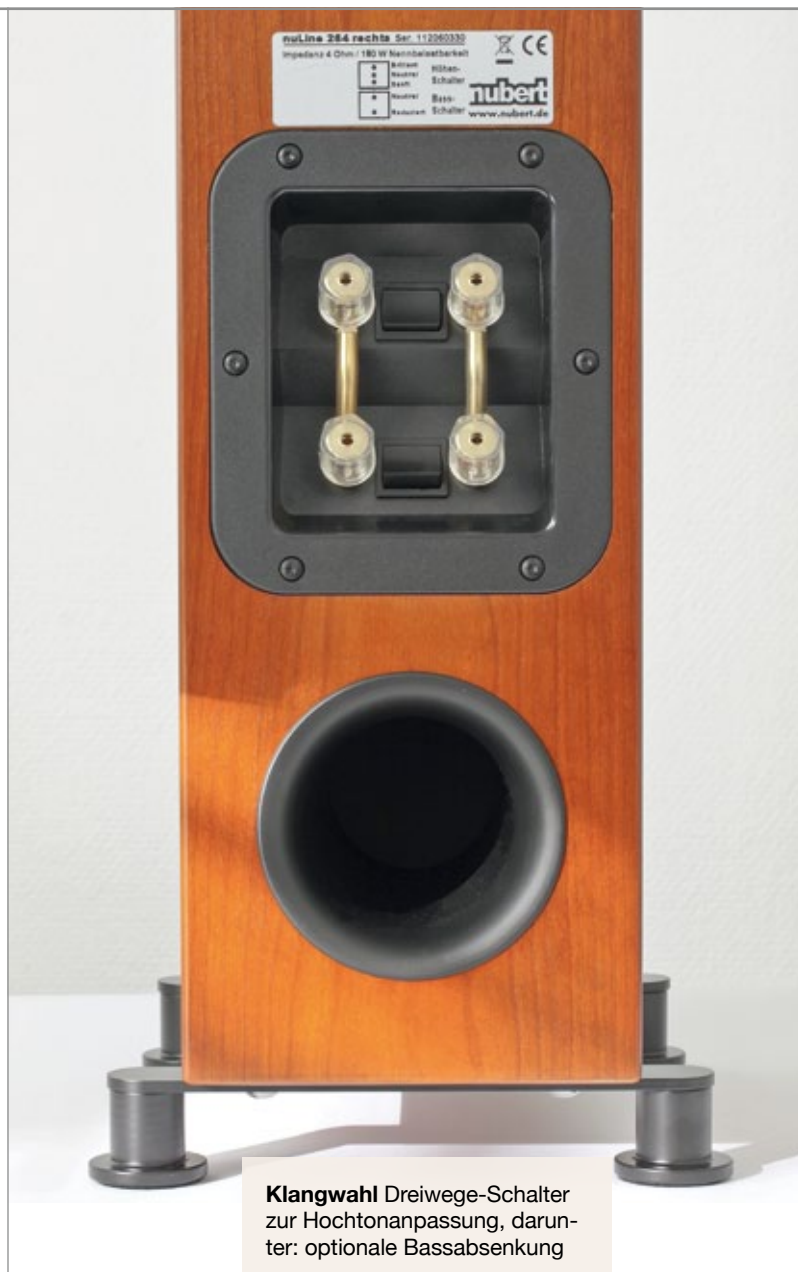
Klangwahl Dreiwege-Schalter zur Hochtönanpassung, darunter: optionale Bassabsenkung

Absolut herausragend finde ich zudem ihre ungemein plastische Darstellung: So gelingt ihr nicht nur ein