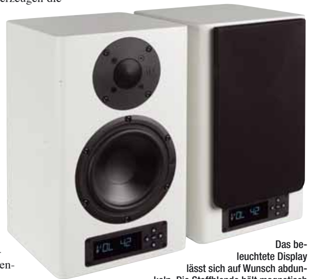
Das beleuchtete Display lässt sich auf Wunsch abdunkeln. Die Stoffblende hält magnetisch