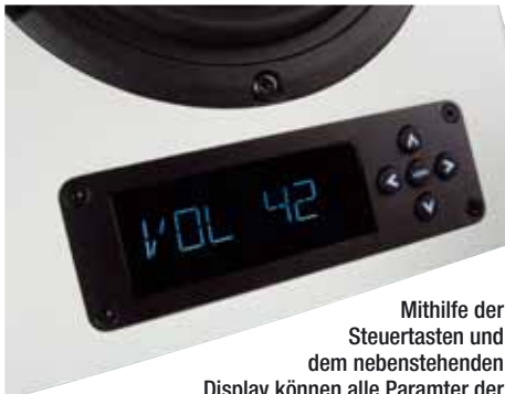
Mithilfe der Steuertasten und dem nebenstehenden Display können alle Parameter der Box bequem eingestellt werden

Z eitgleich mit dem hier vorgestellten Aktivlautsprecher A-200 bietet Nubert das kompaktere Modell A-100, die größere A-300 sowie den Subwoofer AW-350 an, der speziell für die nuPro-Serie entwickelt wurde. Zu Stückpreisen von 285 bis 525 Euro sind die Lautsprecher in schwarzem oder weißem Schleiflack bei Nubert erhältlich; der Subwoofer schlägt mit 445 Euro pro Stück zu Buche. Unsere Testmodelle nuPro A-200 werden für 690 Euro das Paar feilgeboten.