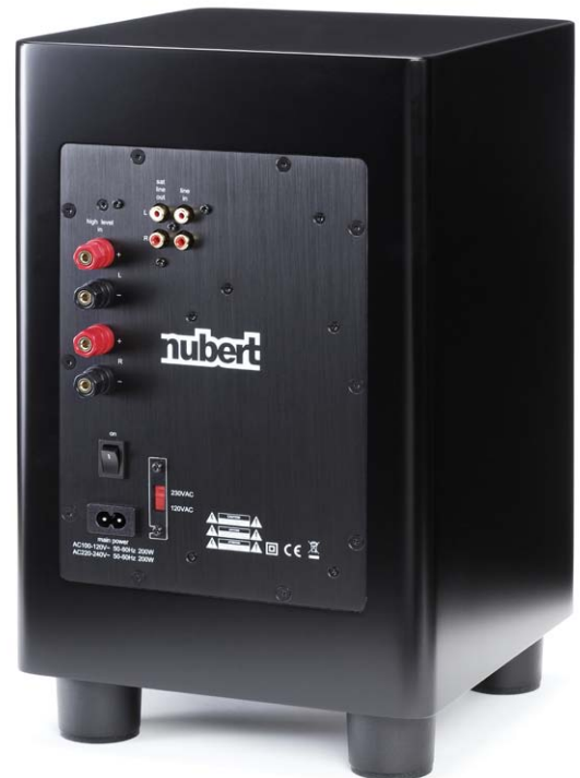
Der Aktivbass von Nubert kann an einem Stereoverstärker als auch an einem Heimkino-Receiver angeschlossen werden

In einem typischen Heimkino-Aufbau wird der Subwoofer ebenfalls über eine Cinchleitung mit dem Sub out des AV-Receiver verbunden. Dabei hat der Nutzer die Wahl, ob er die obere Trennfrequenz im Systemmenü des Verstärkers oder direkt im Aktivmodul des AW-350 justiert. Weitere klangrelevanten Einstellungen erfolgen entweder über die mitgelieferte Fernbedienung oder direkt über das Steuerfeld in der Schallwand. Dabei gibt ein hellblau schimmerndes Display optische Rückmeldung über getätigte Befehle. Die Nummern und Buchstaben sind ausreichend groß, sodass man die eingestellten Parameter auch aus mehreren Metern Entfernung bequem ablesen kann. Welche Klangfilter beim AW-350 genau zum Einsatz kommen, lesen sie im übernächsten Abschnitt.