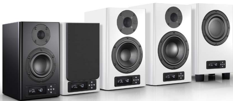
Die aktuelle nuPro-Familie: A-100, A-200, A-300 und AW-350 (von links nach rechts)

den persönlichen Hörgeschmack oder auch die gegebenen Raumakustik anpassen lässt. AV-Magazin beschreibt im Folgendem, welche Merkmale den neuen Nubert-Subwoofer auszeichnen und welche Klangqualität