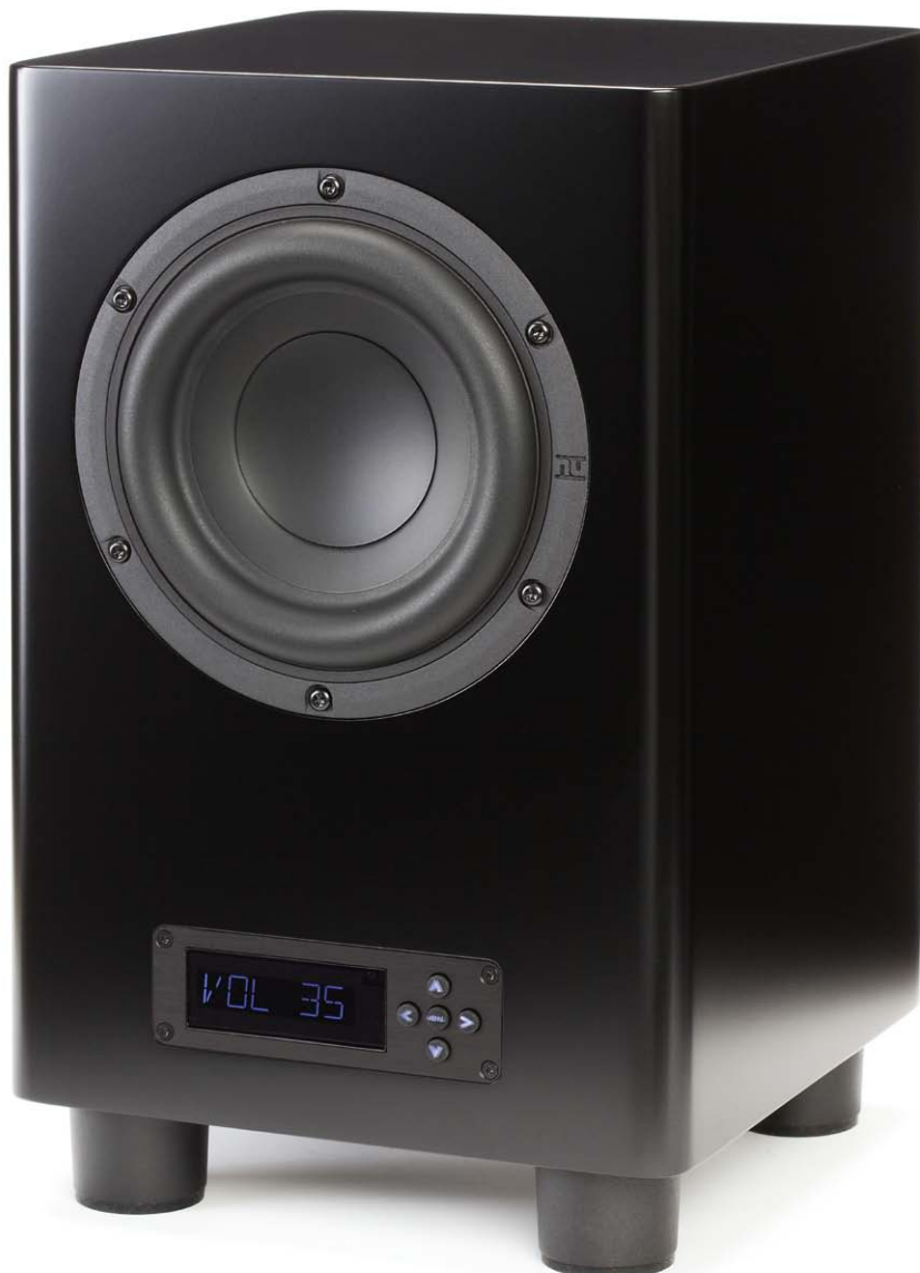
Der Nubert nuPro AW-350 eignet sich für den Musik- und Heimkino-Betrieb

Nubert ist ein schwäbischer Anbieter, der seine Produkte direkt an den Endkunden vertreibt. Auswahl und Kauf erfolgen über den gut sortierten Onlineshop, der unter www.nubert.de zu erreichen ist. Für den sorgenlosen Einkauf bietet der Audiospezialist ein vierwöchiges Rückgabe- und Umtauschrecht. Gefällt der Artikel nicht, kann das Produkt einfach umgetauscht werden. Alternativ wird der volle Kaufpreis erstattet. Wem das noch nicht reicht, kann sich in einem der drei Hörstudios selbst einen akustischen und haptischen Eindruck von den Lautsprechern verschaffen. Die Vorführgeschäfte befinden sich in Aalen, Schwäbisch Gmünd und neuerdings auch in Duisburg. Im Lieferumfang sind der Subwoofer samt Frontabdeckung, eine Fernbedienung und ein Netzkabel enthalten.