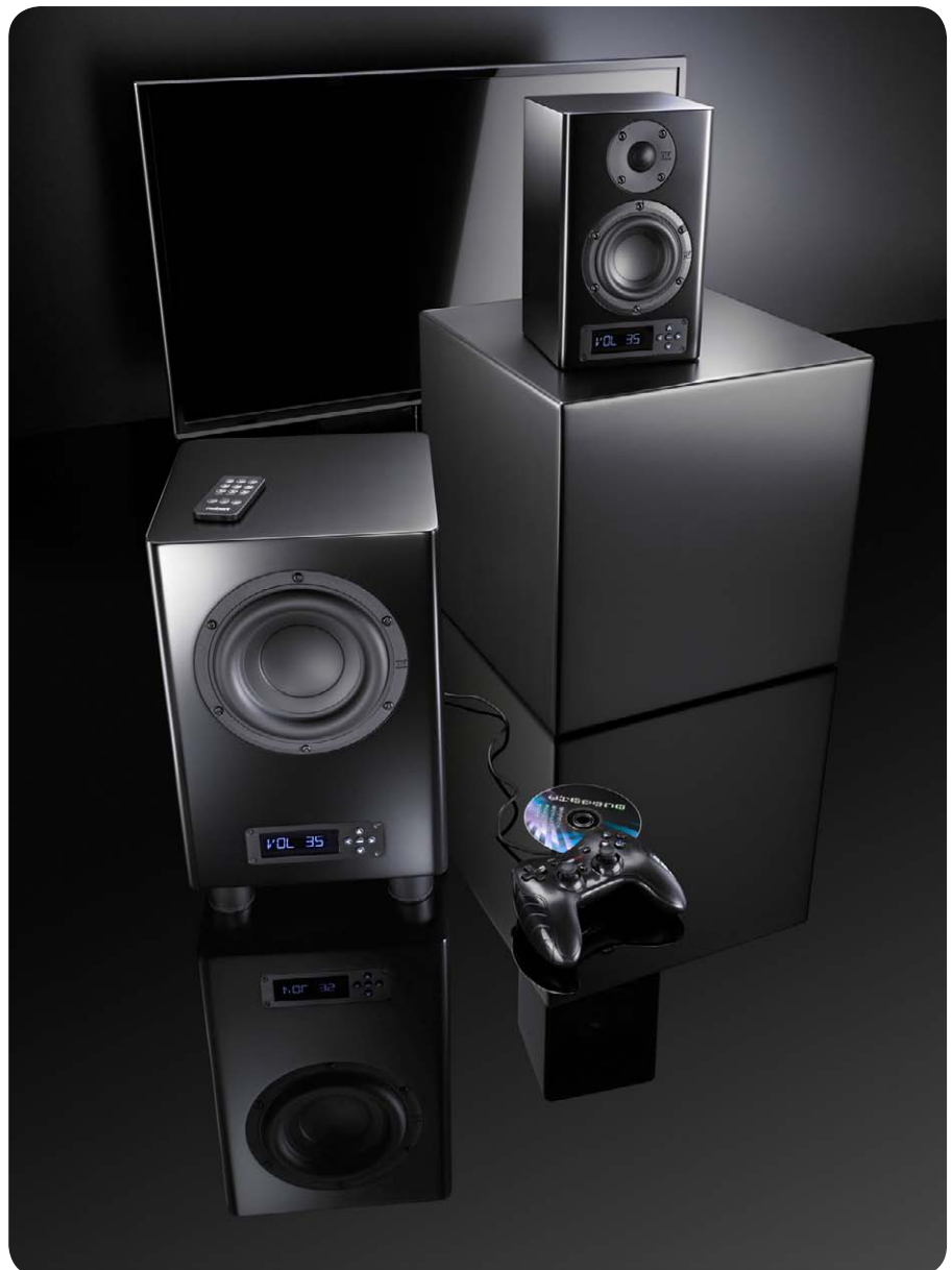
Der nuPro-Subwoofer AW-350 eignet sich für HiFi-, Heimkino-, Studio- und Multimedia-Anwendungen

Für den Hörtest stellen wir dem nuPro AW-350 ein Paar nuPro A-100-Kompaktlautsprecher zur Seite. Die kleinen Aktivboxen sind die idealen Spielpartner für den Kompaktsubwoofer. Als Zuspeler kommt ein