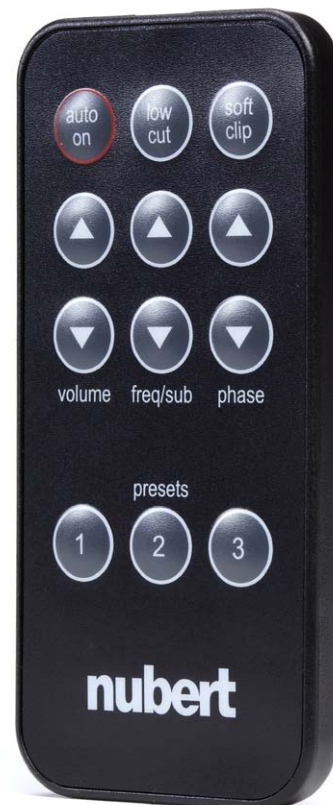
Die handliche Fernbedienung erlaubt eine komfortable Klang- und Lautstärken-Regelung

Der nuPro AW-350 ist ein sehr kompakter und somit wohnraumfreundlicher Subwoofer. Als Farbvarianten stehen aktuell ein schwarzer und weißer Schleiflack zur Wahl. Der Farbauftrag ist Nubert-typisch absolut tadellos, gefällt mit gleichmäßiger Ober-