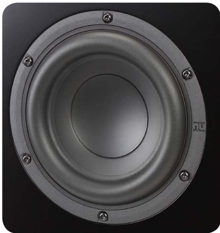
Für die potente Tieftonwandlung sorgt ein hubstarker 18-Zentimeter-Töner