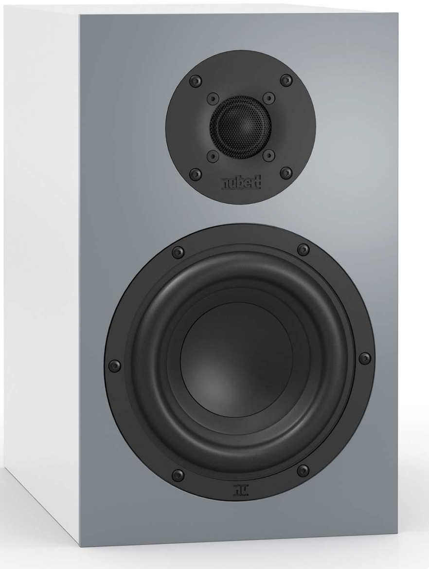
Die nuBoxx B-40 wirkt über ein Zweiwegesystem, das aus einem 18-Zentimeter-Tiefmitteltöner und einer 26-Millimeter-Hochtönerkalotte besteht

empfiehlt sich die quadratische, nur 80 Millimeter dünne Flachbox nuBoxx BF-10. Als Centerlautsprecher in einem Heimkino kann der kompakte Doppelbasslautsprecher nuBoxx B-50 zum Einsatz kommen. Nach oben hin runden die beiden Standlautsprecher nuBoxx B-60 und nuBoxx B-70 die Modellvielfalt ab. Wer sich sprichwörtlich ein Bild von den Lautsprechern in den heimischen vier Wänden machen möchte, sollte die nuReality-App auf sein Smartphone laden. Mit der Nubert-App können sämtliche nuBoxx-Lautsprecher virtuell im Wohnraum platziert und aus allen Blickwinkeln betrachtet werden.