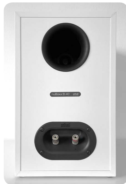
In der Rückwand sind das Kabelanschlussfeld und das Bassreflexrohr eingelassen

Die neue nuBoxx-Serie besitzt alle Lautsprechertypen für eine perfekte Musik- und Filmtone-Wiedergabe. Ob stereofones HiFi- oder mehrkanaliges Heimkino-Setup, die gebotene Bandbreite ist groß. Neben dem hier vorstelligen Kompaktlautsprecher nuBoxx B-40 gibt es einen kleinen Regallautsprecher namens nuBoxx B-30. Für die platzsparende Installation an einer Wand