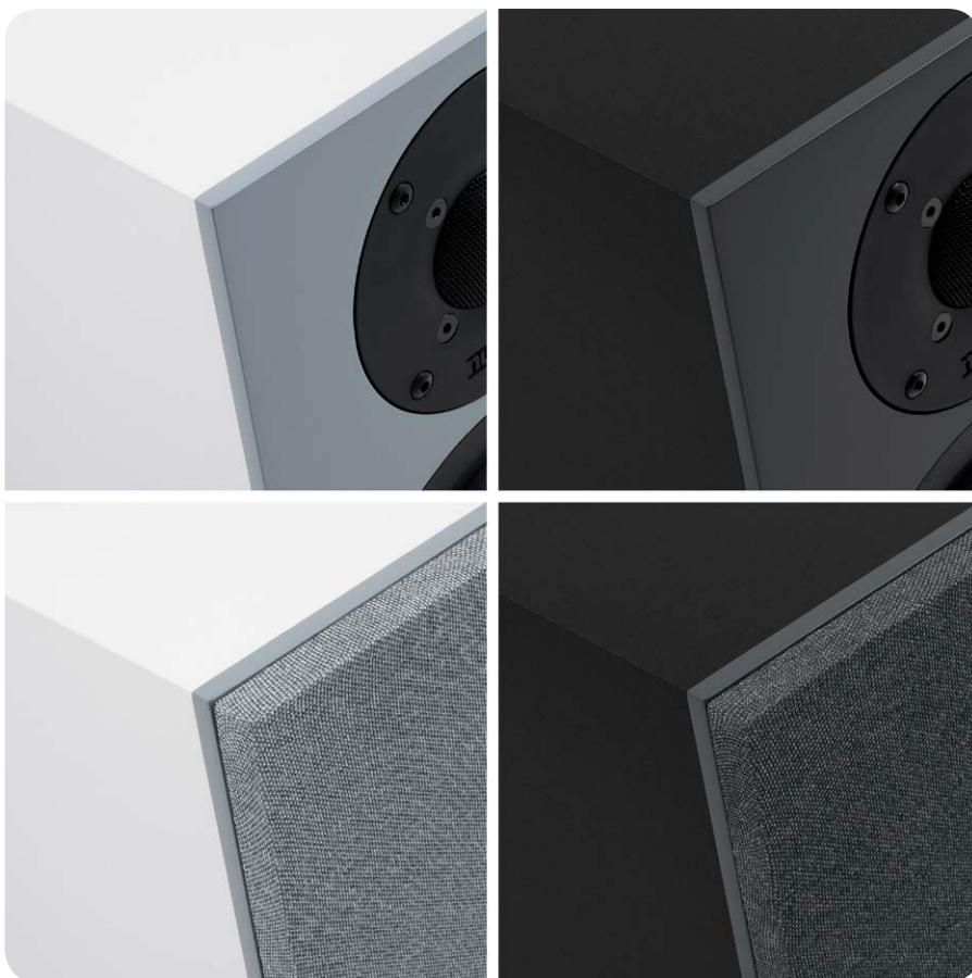
Sämtliche Lautsprecher der neuen nuBoxx-Serie sind in Schwarz und Weiß zu haben. Die Schallwände sind lackiert, die dahinterliegenden Korpusse foliert

bran aus Polypropylen. Für bestmögliches Hubvermögen sorgt eine großdimensionierte, wulstige Gummisicke, die Membran und Chassiskorb verbindet. Ab rund 2.000 Hertz kommt der neue nuOva B-Hochtöner ins Spiel, der über eine 26 Millimeter messende