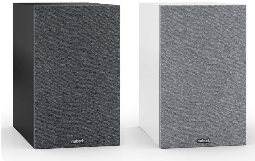
Die Frontrahmen gehören zum Lieferumfang und halten per Magnettechnik auf der Schallwand

Textilkalotte wirkt. Dank der bedämpften Resonanzkammer hinter dem Membrandom konnte das Abstrahlverhalten gegenüber dem Vorgängermodell nochmals verbessert werden. Wie sich das im Klang bemerkbar macht, lesen Sie im folgenden Abschnitt.