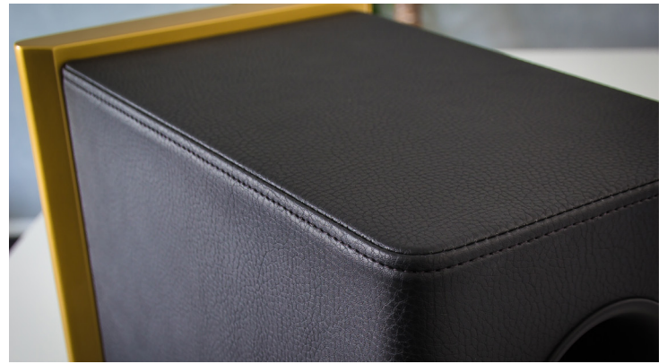
Edle Mantelung: Der Korpus der Nubert nuVero 60 Exclusiv ist mit einem optisch und haptisch erstklassigen Kunstleder bezogen.