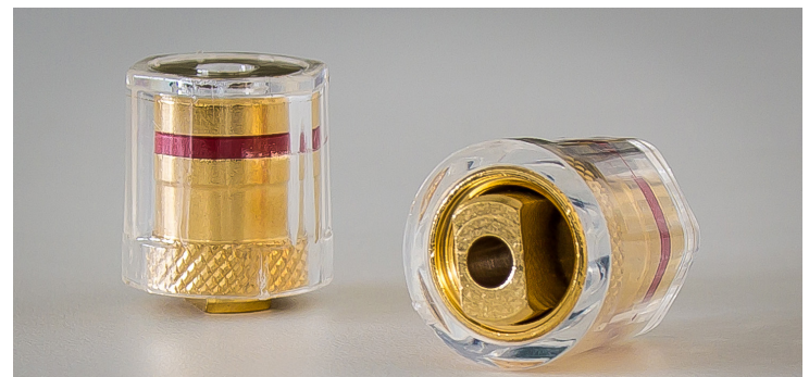
Der Stempel der Überwurfmutter presst die Litze an – mit einem definierten maximalen Anpressdruck, um das Material zu schonen.

Selbst bei den Kabelaufnahmen präsentiert Nubert eine nicht alltägliche Lösung: Die Klemmen bestehen aus Metall, die Überwurfmuttern besitzen zusätzlich einen durchsichtigen Kunststoff-Überzug – soweit alles gängig. Ungewöhnlich ist hingegen, dass die Klemmenstifte keine runde Bohrung besitzen, durch die das blanke Lautsprecherkabel geführt wird, sondern einen durchgängigen Schlitz. Die übergeworfene Mutter klemmt das Kabel deshalb auch nicht mit einer Kontaktscheibe fest, sondern mit einem quaderförmigen, mittigen Metallstempel, der durch das Festziehen der Mutter in den Klemmschlitz eingesenkt wird. Beim Festziehen passiert Erstaunliches: Irgendwann lässt sich der Kopf der Mutter zwar weiterdrehen, dies bewirkt aber kein stärkeres Anziehen. Der Anpressdruck übersteigt also nie ein definiertes Maß. Hier folgt Nubert der Argumentation, dass ab einem gewissen Punkt ein höherer Anpressdruck nicht mehr die Signalübertragung verbessert, sondern nur noch die Hardware verschlechtert, weil die Oberflächen von Kabel und Klemme in Mitleidenschaft gezogen wird. Diese Klemmen sind somit echte Kabelschoner. Vier von ihnen bietet das Terminal der nuVero 60 Exclusiv an, das ermöglicht jenseits des normalen Betriebs mit einem Verstärker und einem Paar Lautsprecherkabel also auch Bi-Wiring oder Bi-Amping. Hierfür entfernt man die Kabelbrücken, mit denen die Nubert nuVero 60 Exclusiv ab Werk geliefert wird.