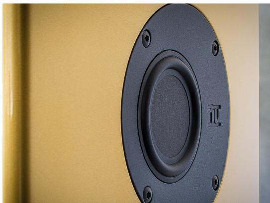
Auch der Mitteltöner ist exzentrisch platziert, außergewöhnlich ist auch seine Ausführung als Flachmembran mit kleiner Membranfläche, die als Sandwich mit Wabenstruktur aufgebaut ist.