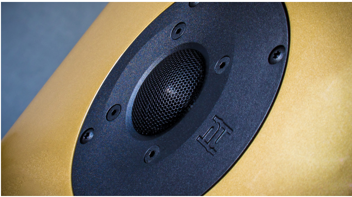
Der Hochtöner hat einen seitlichen Versatz, diese Asymmetrie dient der Verringerung der klangschädlichen Kantendispersion.