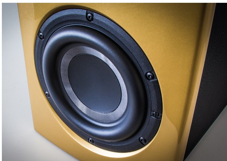
Der 18-Zentimeter-Woofer sorgt für den Tiefton-Wiedergabe, zur optimalen vertikalen Abstrahlung besitzt seine Behausung oben und unten dezente Schallführungen.