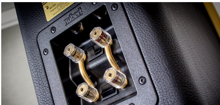
Die Nubert nuVero 60 Exclusiv ist mit einem speziellen Terminal ausgestattet: Hier sind sowohl die Wippschalter der Klangregelung die Polklemmen für die Lautsprecherkabel untergebracht.