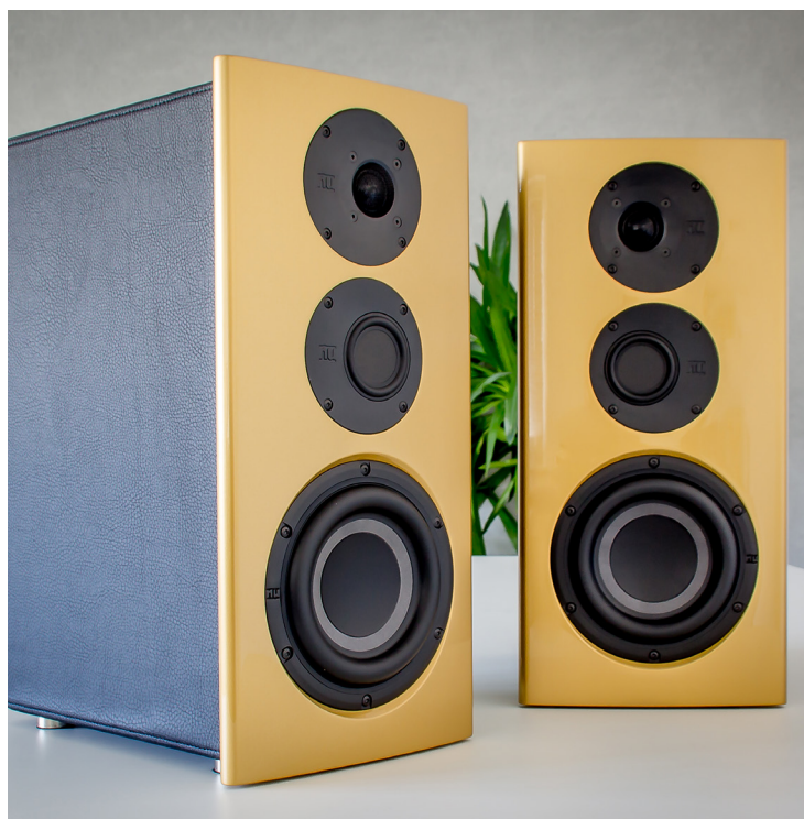
Hommage an die Historie: Die Nubert nuVero 60 Exclusiv erinnert mit ihrer goldenen Front an den Ruf von Schwäbisch Gmünd als Gold- und Silberstadt.

der optimalen Schallabstrahlung und soll andererseits den Einfluss der Kantendispersion minimieren, also die Brechungen des sich ausbreitenden Schalls an den Begrenzungen der Front. Das Klangsegel war bei der normalen nuVero-Linie bislang in Schwarz, Weiß und Braun gehalten, die Exclusiv hingegen wird ausschließlich mit einer Schallwand in Edelmetall-Lackierung offeriert, in goldenem oder silbernem Metallic-Look. Dies ist eine Hommage an die Heimat und die Historie: Nuberts Firmensitz Schwäbisch Gmünd gilt als Stadt der Gold- und Silberschmiede. Unser Testmodell glänzt golden, die Front besitzt aber eine zarte, raffinierte Körnung, die erst bei näherem Hinsehen zu erkennen ist. Sie verleiht der spiegelglatten Lackierung eine schöne Tiefe und Struktur. Der hochwertige Überzug ist erstklassig aufgetragen und perfekt poliert, wir haben den Lack gegen das Licht betrachtet, da ist nicht eine Unebenheit oder Welligkeit zu sehen. Wer sich die Exclusiv-Version der nuVero 60 gönnt, möchte diese Optik natürlich nicht verbergen, deshalb gibt es die Sonderedition nur ohne jene Abdeckung, die zum Lieferumgang des Standardmodells gehört. Positiver Nebeneffekt: Die Front ist nun frei von Vertiefungen für die Gitter-Fixierung.