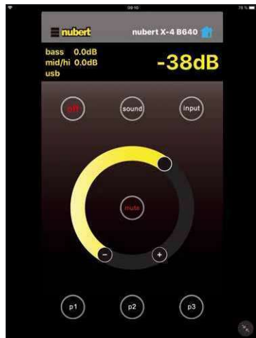
Mit der App lassen sich Standardfunktionen und die Raumkorrektur einstellen

Das Gehäuse der X-6000 RC besteht aus lackiertem MDF und macht, wie bereits angemerkt, einen tadellosen optischen und haptischen Eindruck. Ein solider Standfuß aus Metall