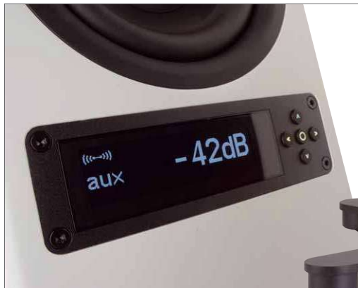
Sind beide Boxen konfiguriert, ist nur das Bedienfeld des Masterlautsprechers aktiv

Mit seinen zahlreichen Anschlüssen ist die X-6000 RC so gut ausgestattet, wie kaum eine andere Aktivbox