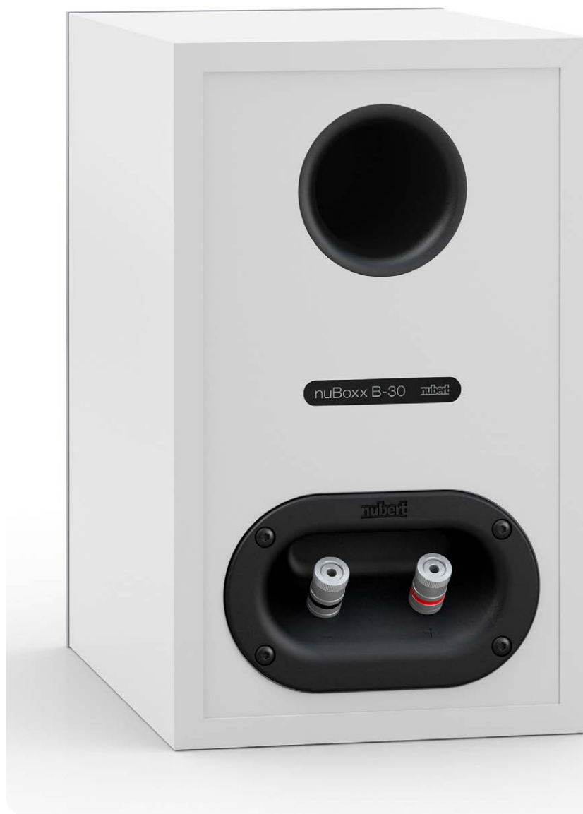
Auf der Rückseite der B-30 sind das Bassreflex-Rohr und das Kabelanschlussfeld eingelassen

Die nuBoxx B-30 generiert ihre akustische Leistung über zwei Lautsprecher-Chassis, die zu einem Zweiwege-System zusammenschaltet sind. Oben sitzt der nuOva B-Hochtöner, der in allen Lautsprechern der nuBoxx-Serie zum Einsatz kommt. Geschützt hinter einem stabilen Metallgitter werkelt eine 26 Millimeter kleine Kuppelmembran aus Textilfasern. Eine bedämpfte Kammer hinter der Kalotte sorgt im Übergangsbereich zum Tiefmitteltöner für eine resonanzarme Wiedergabe. Der darunterliegende Basstreiber namens B2 misst 15 Zentimeter und wirkt über eine Kunststoffmembran aus Polypropylen. Nubert verwen-