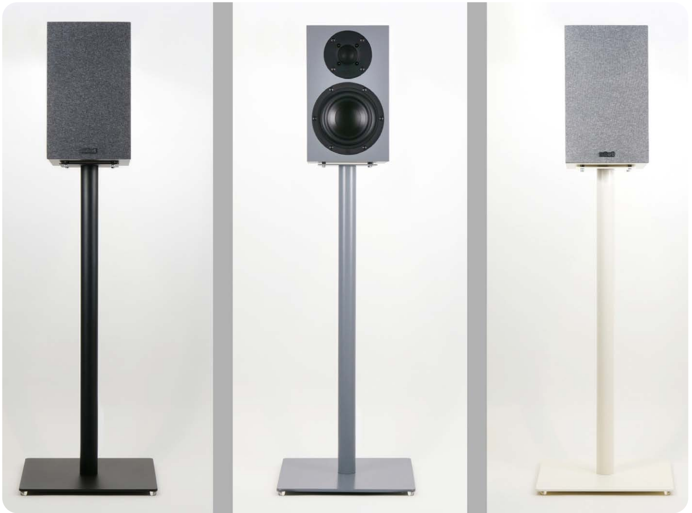
Die optionalen Boxenstative MS-67 passen perfekt zu der nuBoxx B-30 und kosten 149 Euro pro Paar

Rückgaberecht und, auf Wunsch, sogar eine Null-Prozent-Finanzierung über 12 Monate. Lesen Sie im folgenden Bericht, mit welchen Qualitäten der Nubert-Lautsprecher überzeugt und ob eine Anschaffung lohnt.