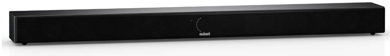
Hinter der schwarzen Frontblende sitzt mittig ein Regler mit Tastenfunktion, über den Einstellungen am Gerät vorgenommen werden

kelt ein vollwertiges Stereo-HiFi-System, das in der linken und rechten Seite je aus einem Hoch-, Mittel- und Tieftöner besteht. Letztgenannter ist 90 Millimeter groß, in der Bodenplatte verbaut und strahlt direkt gegen die Stellfläche. Der dafür nötige Abstand wird durch die mitgelieferten, rutschfesten Gummifüße sichergestellt. Mittelfrequente Tonumfänge werden von zwei 66 Millimeter messenden Konustöner wiedergegeben. Diese sind in der Schallwand verbaut und strahlen zusammen mit den 25-Millimeter-Hochtönern nach vorne zum Zuhörer ab. Für optimale Signalwandlung ist ein Digitalverstärker im Einsatz, der bis zu 200 Watt Leistung kurzfristig generieren kann. Damit mehrkanalige Tonformate verarbeitet werden können, verfügt die nuPro AS-2500 über Dolby- und DTS-Decoder. Dank HDMI-Verbindung mit erweitertem Audiorückkanal kann die Nubert-Soundbar so auch hochauflösende Audiosignale verarbeiten.