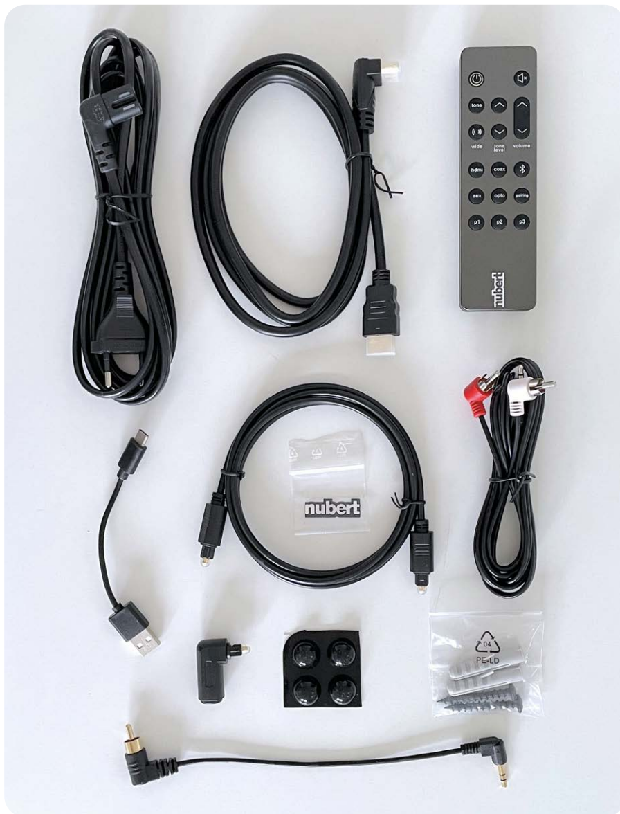
Vorbildlich! Nubert legt sämtliches Zubehör bei, um die Soundbar vollumfänglich in Betrieb zu nehmen

Mit einer Gehäusebreite von 105 Zentimetern passt die Nubert-Soundbar perfekt unter Fernseher mit Bild diagonalen von 46 Zoll und mehr. Dank des flachen Korpus' kann die rund sieben Zentimeter hohe Soundbar direkt unter einen Fernseher auf einem TV-Regal oder Sideboard gestellt werden. Alternativ erfolgt die platzsparende Montage an der Wand. Dafür sind auf der Rückseite zwei Metallwinkel verschraubt. Die Kabelverbindungen geschehen über ein versenktes Anschlussfeld. Den Ton vom Fernseher nimmt die nuPro AS-2500 über das beigelegte HDMI-Kabel entgegen. Blu-ray-Spieler oder Spielekonsolen können direkt mit dem TV verbunden werden.