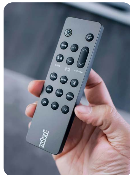
Mit der übersichtlich gestalteten Fernbedienung werden die zahlreichen Klangeinstellungen komfortabel vom Sofa aus angepasst

Die Nubert-Soundbar generiert ein enorm breitbandiges Wiedergabevermögen aus dem zierlichen Gehäuse. So begeistert die nuPro AS-2500 beim Hörtest mit einem kraftvollen und dynamischen Klang. Dank der zwei Langhub-Tieftöner klingen die Bässe erstaunlich satt und voluminös. Und auch bei gehobener Lautstärke beweist die schlanke Soundbar ihr Stehvermögen, klingt