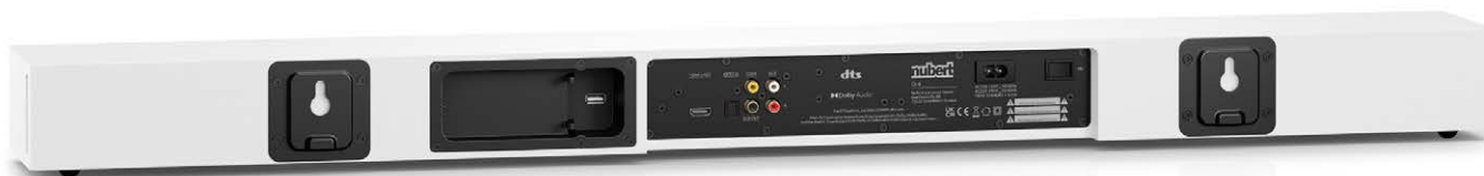
Auf der Rückseite der Soundbar befinden sich analoge und digitale Anschlüsse sowie Schlüssellochhalter für die platzsparende Wandmontage

chen Soundbar das Maximum an Klang herauszuholen. Für ein intensives Klangerlebnis bei Filmen, Serien und Sport-Ereignissen. Neben der Wiedergabe des TV-Tons kann der Nubert-Lautsprecher dank Bluetooth kabellos Musik empfangen. Und das von jedem Smartphone, Tablet oder Computer. Gameton von Handy-Spielen, YouTube-Videos und Musik aus Streaming-Apps wie Spotify können so in bester Klangqualität genossen werden. Zudem beherbergt die nuPro AS-2500 Dolby- und DTS-Decoder. Und das ist noch nicht alles, was der schlanke Klangriegel zu bieten hat. Lesen Sie im folgenden Test, was diese Soundbar im Detail auszeichnet.