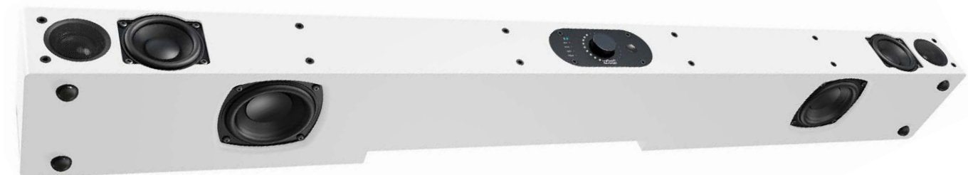
Ein Blick unter die Soundbar: Die Nubert nuPro AS-2500 arbeitet über ein vollwertiges, stereofones Dreiweg-System