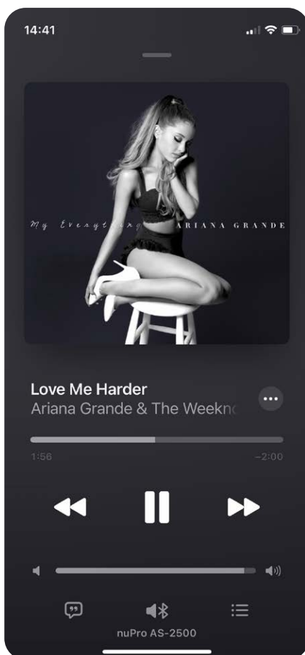
Dank aptX- und AAC-Codec geschieht das Bluetooth-Streaming besonders klingstark

Für den kabellosen Musikempfang via Smartphone, Tablet oder Computer besitzt die nuPro AS-2500 einen Bluetooth-Empfänger. Dank der Kompatibilität zu den Codecs aptX HD, aptX Low Latency und AAC bürgt dieser im Zusammenspiel mit kompatiblen Android- und Apple-Smartphones für optimale Klangqualität. Vor der erstmaligen Nutzung müssen Smartphone, Tablet oder