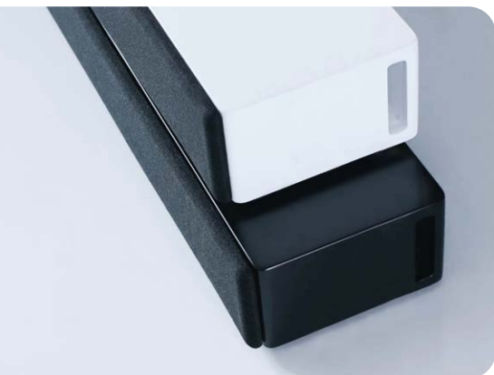
Die nuPro AS-2500 gibt es in den seidenmatten Lackvarianten Schwarz und Weiß

Die Tonübertragung zur Nubert-Soundbar erfolgt dann über den Audiorückkanal des TV-Ausgangs, sodass auch Dolby- und DTS-codierte Tonspuren von der nuPro AS-2500 gewandelt werden können. Wer der Soundbar einen optionalen Subwoofer zur Seite stellen möchte, kann diesen am gleichnamigen Cinch-Ausgang verbinden. Über den optionalen Funkadapter nuConnect trX können Subwoofer der nuSub-Serie drahtlos