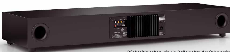
Rückseitig sehen wir die Reflexrohre der Subwoofer, das Anschlussfeld und die Kühlrippen der kräftigen Verstärkereinheit, mit der die Chassis einzeln angesteuert werden