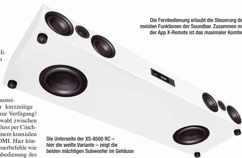
Die Unterseite der XS-8500 RC – hier die weiße Variante – zeigt die beiden mächtigen Subwoofer im Gehäuse

die dazwischen liegende 25-Millimeter-Gewebekalotte für einen angenehm detaillierten und präzisen Hochtonbereich sorgt. In Sachen Elektronik gibt es beeindruckende 580 Watt Dauer-Verstärkerleistung in Class-D-Technik, die für mehr als ausreichend Schalldruck sorgen. Für kurzzeitige Impulse stehen sogar 820 Watt zur Verfügung! Eingangsseitig hat man die Auswahl zwischen dem klassischen analogen Anschluss per Cinch-Buchsen, einem optischen und einem koaxialen Digitaleingang und natürlich HDMI. Hier können per eARC grundsätzliche Steuerbefehle wie „Laut-Leise“ auch über die Fernbedienung des Fernsehers entgegengenommen werden. Zusätzlich gibt es einen Subwoofer-Ausgang per Cinch und – ganz wichtig für den komfortablen Musikgenuss über das Smartphone – einen Bluetooth-Eingang, natürlich mit dem hohen aptX-Standard für höchste Klangqualität. Die grundsätzlichen Funktionen der XS-8500 RC lassen sich über das einfach, aber effektiv gestaltete Frontpanel steuern. Komfortabler wird es dann mit der mitgelieferten Fernbedienung, mit der sich dann sehr tief in die Klanggestaltung eingreifen lässt. Noch besser wird es mit der Nubert X-Remote-App, mit der sich alle Funktionen optimal steuern lassen. Dazu gehört übrigens auch eine Raum-Einmessfunktion, die das eingebaute Mikrophon von iPhones als Messmikrophon benutzt, um Raumresonanzen im Frequenzgang der eingebauten Subwoofer auszugleichen.