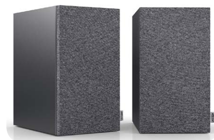
Die mit grau-meliertem Stoff bezogenen Frontrahmen sind im Lieferumfang enthalten