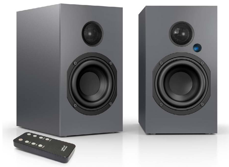
Die Nubert nuBox A-125 ist nur 24,5 mal 13,5 Zentimeter groß

der Aktivlautsprecher erfolgt über die beigelegte Fernbedienung. Diese ist klein, handlich und sehr übersichtlich gestaltet. Mit ihr können Lautstärke, Quellenwahl und Klangmodi schnell und einfach eingele-