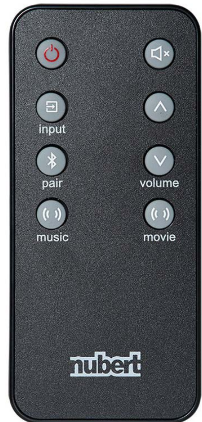
Die Fernbedienung bietet komfortablen Zugriff auf sämtliche Funktionen