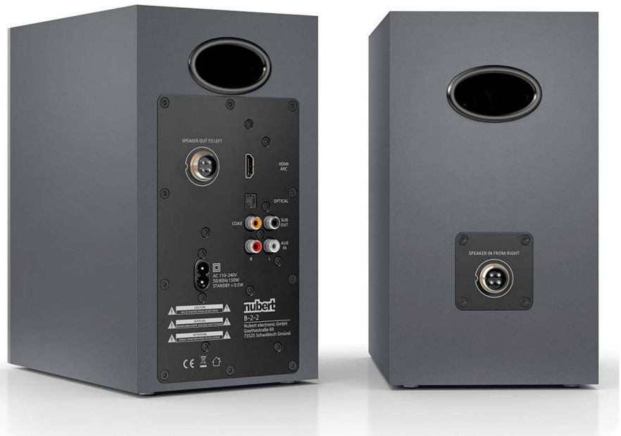
Neben dem HDMI-Eingang stehen je zwei digitale und analoge Audioanschlüsse zur Verfügung

Neben der obligatorischen Wiedergabe des TV-Tons empfängt die nuBox A-125 Musik via Bluetooth und somit kabellos. Sind das Smartphone, Tablet oder der Rechner mit der A-125 verbunden, kann der Ton von YouTube-Videos, Handygames, Podcasts und Spotify-Playlisten komfortabel von der Couch