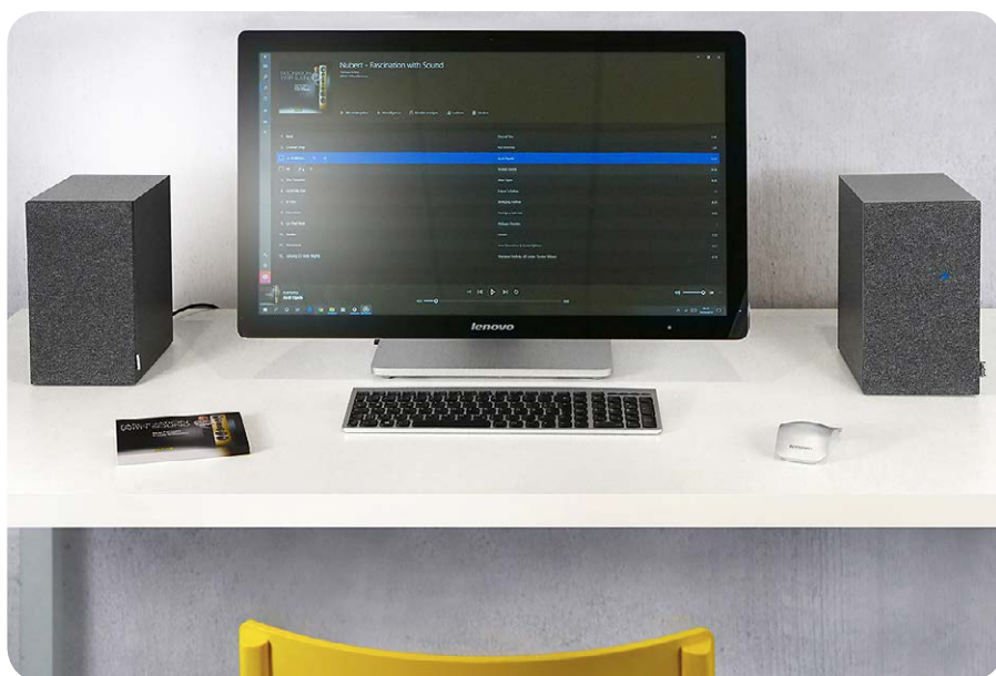
Computer können über den analogen Cinch- oder optisch-digitalen beziehungsweise elektrisch-digitalen Anschluss verbunden werden

Die nuBox A-125 erstaunt beim Hörtest mit hohem Auflösungsvermögen und brillantem Detailreichtum. Dank des erstklassigen Hochtöners spielt die kleine Box sehr lebendig und agil. Streicher und Blasinstrumente klingen demnach besonders ausdrucksstark und facettenreich. Stimmen werden tonal neutral und sehr authentisch wiedergegeben, was Gesang und Sprache bei Musik und TV-Ton perfektioniert. Im Bassbereich gefällt der Konustöner mit einem Druckvermögen und Tiefgang, den man einem so kleinen Chassis nicht zugetraut hätte. Um das tieffrequente Leistungsvermögen