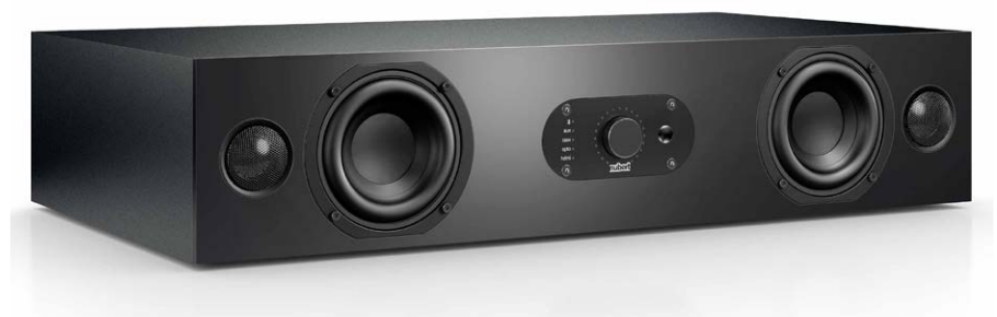
Die nuBoxx AS-225 max besitzt ein Stereo-Lautsprechersystem, das aus je zwei Hoch- und Tiefmitteltönern besteht