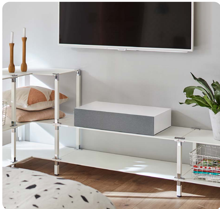
Das Nubert-Sounddeck nuBoxx AS-225 max ist in Weiß und Schwarz erhältlich. Die magnetisch haftende Stoff-Frontblende gehört zum Lieferumfang

empfängt das AS-225 max digitale Audio-signale in bestmöglicher Qualität. Neben Stereoton kann das Nubert-Deck mehrkanalige Datenströme empfangen. Dank des eingebauten Dolby Digital-Decoders sollte der Audioausgang des Fernsehers auf Bitstream gestellt werden. Durch die Integration des sogenannten CEC-Standards kann die Lautstärke des Soundboards sogar mit der TV-Fernbedienung geregelt werden. Für Fernseher ohne HDMI-Anschluss kann der optische Digitaleingang genutzt werden. Dieser liegt als klassische Toslinkbuchse vor und nimmt ebenso digitale Audiosignale von Festplattenrekordern, Spielekonsolen oder Netzwerkstreamern entgegen.