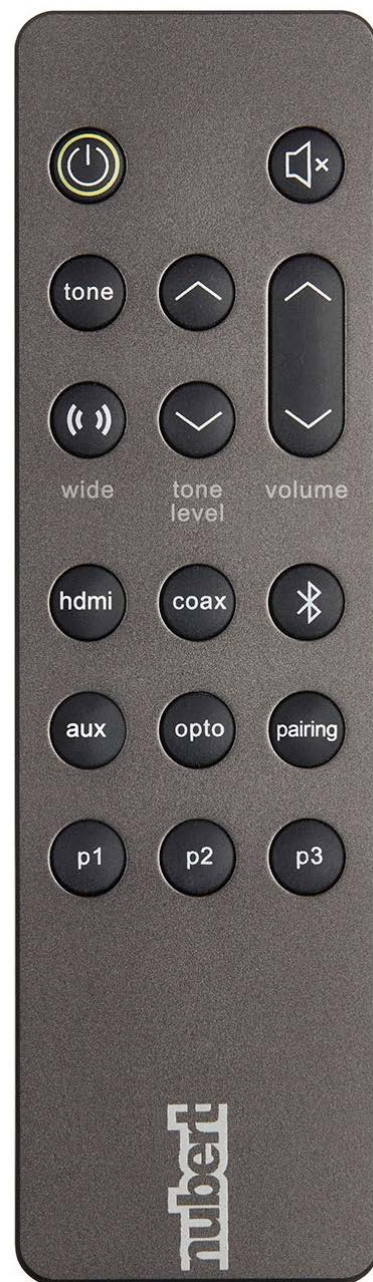
Die beigelegte Fernbedienung ist hochwertig gearbeitet und ergonomisch gestaltet

Für den kabellosen Musikempfang hat Nubert die Bluetooth-Technik implementiert. Somit empfängt die nuBoxx AS-225 max Musik, Spiele- und Videoton von jeder Smartphone- oder Tablet-App. Bequem von der Couch aus, ganz ohne Kabel. Zudem können über Bluetooth Mac- und PC-Computer klangstark und kabellos Musik, Film- und Gameton an das Nubert-Deck senden. Für maximale, weil hochauflösende Soundqualität bei PCs und Android-Geräten bürgt der aptX HD-Codec von Qualcomm. Apple-Anwender freuen sich über den Advanced Audio Codec, kurz AAC, mit dem iPads und