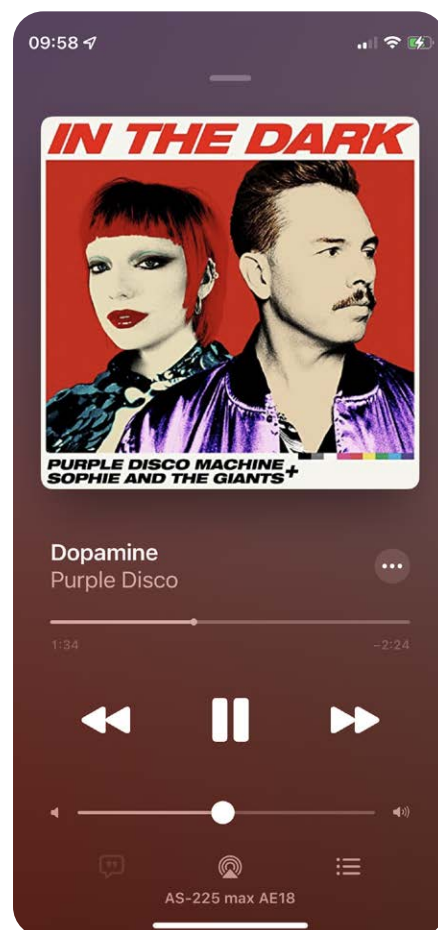
Über Bluetooth empfängt das Sounddeck kabellos Musik, Video- und Gameton von Smartphones, Tablets und Computern

Abmessungen generiert die nuBoxx AS-225 max so erstaunlich tief reichende Bässe. Wer einen dreidimensionalen Höreindruck erfahren möchte, sollte den Raumklingmodus aktivieren. Dann verbreitert sich die akustische Bühne in Tiefe und Breite, was das Hörerlebnis perfektioniert. Das macht richtig Spaß. Und auch beim kabellosen Musikstreaming via Smartphone punktet