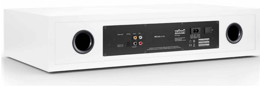
In der Rückseite befinden sich analoge und digitale Anschlüsse für Fernseher, CD-Spieler und Festplattenrekorder. Die beiden Reflexrohr-Öffnungen intensivieren die Basswiedergabe

ten Gehäuse untergebracht. Der Fernseher wird einfach auf die stabile nuBoxx-Basis gestellt, was Platz im Wohnraum spart. Zu haben ist die einteilige Klanglösung für 498 Euro. Ob sie das wert ist, erfahren Sie im folgenden Test.