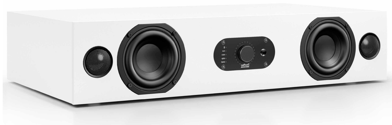
Das mittig positionierte Bedienfeld mit großem Zentralregler erlaubt eine treffsichere Bedienung des Sounddecks