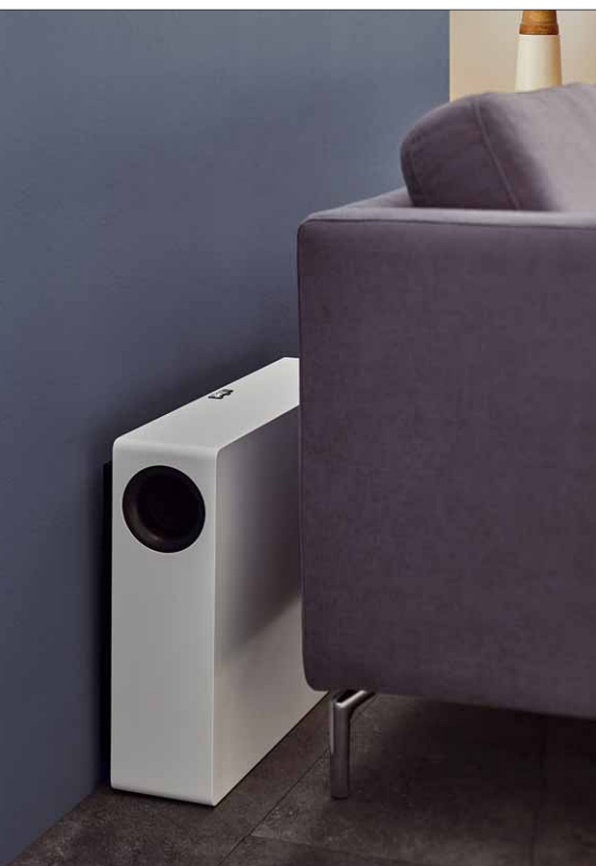
Aufgestellt passt der XW-800 slim auch an die Wand