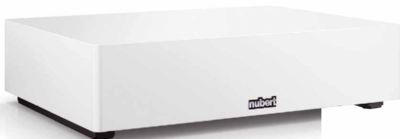
Unscheinbar und sehr flach verschwindet der Nubert Subwoofer optisch

Die Technik samt Modul und Treiber findet man an der Unterseite