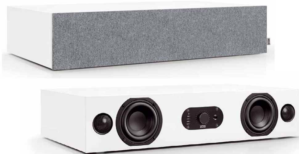
Zwei Treiber pro Seite, dazwischen das grundsätzliche Bedienfeld. Wem das zu technisch aussieht, setzt die elegante Frontblende auf

Die Herausforderung, der sich Nubert aber eben auch erfolgreich stellt, ist es, diese Leistung mit möglichst wenigen Einschränkungen auch in kompakteren, günstigeren Lautsprechern zu bieten – letzten Endes sogar in der kompaktesten Bauform für Stereo-Sound, einer Soundbar. Ein paar der neuen Modelle haben wir ja schon getestet und für exzellent befunden, hier geht es um das Modell AS-225 max, dem wir auf Vorschlag der Firma Nubert den flachen Subwoofer XW-800 slim zur Seite gestellt haben.